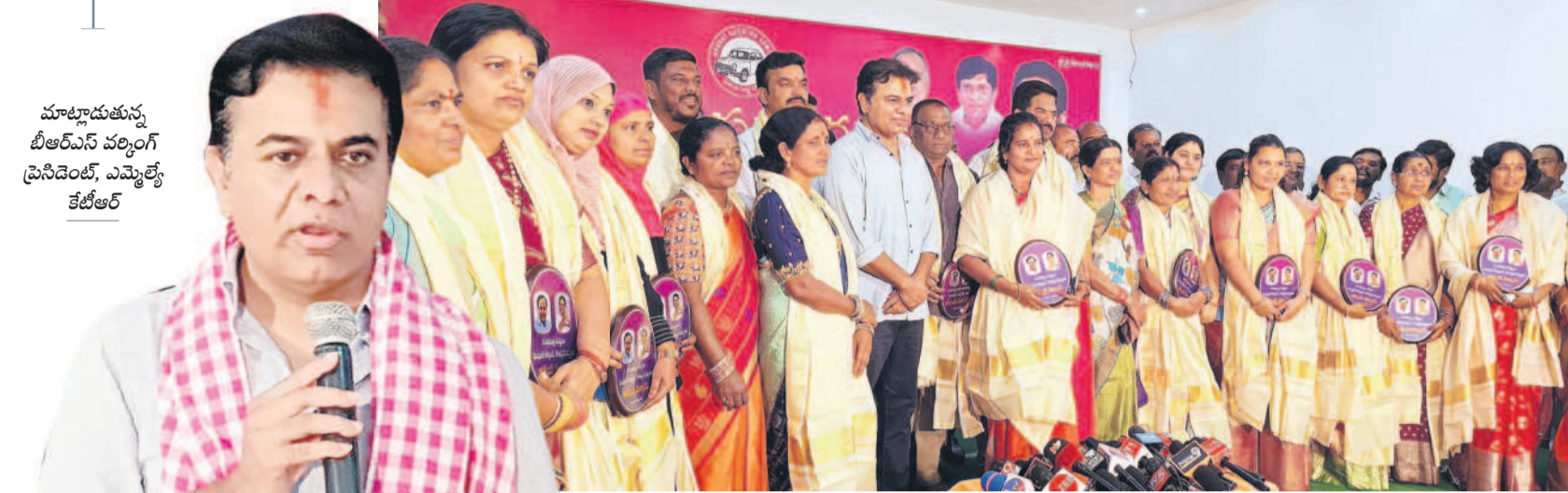
మాట్లాడుతున్న బీఆర్ఎస్ వర్కింగ్ ప్రెసిడెంట్, ఎమ్మెల్యే కేటీఆర్