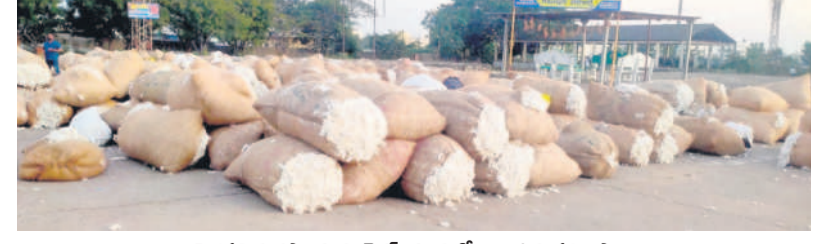
పెద్దపల్లి వ్యవసాయ మార్కెట్ యార్డులో నిల్వ ఉన్న పత్తి బండ్లు