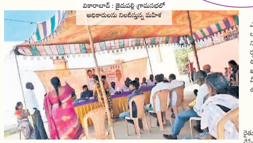
వికారాబాద్ : జైడుపల్లి గ్రామసభలో అధికారులను నిలదీస్తున్న మహిళ