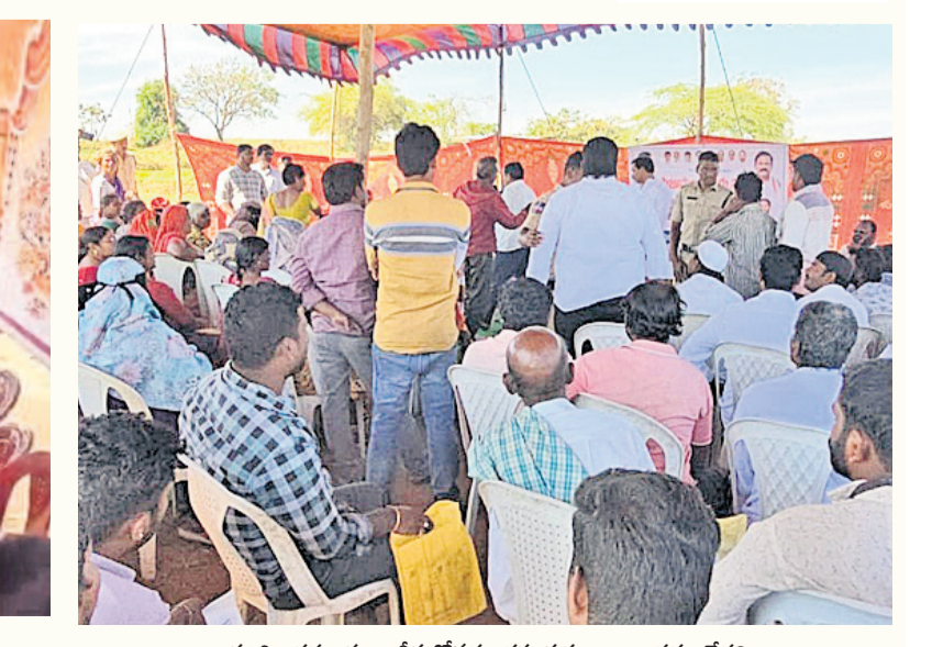
పరిగి : దరఖాస్తులు తీసుకోవడం తప్ప, పథకాలు అందడం లేదని అధికారులను నిలదీస్తున్న పరిగి పడోపాడు గ్రామం

జిల్లాలోని ప్రజల్లో తీవ్ర నిరసన వ్యక్తమైంది. కొత్త రేషన్ కార్డుల కోసం ప్రతి గ్రామంలోనూ ప్రజలు అధికారులను నిలదీశారు. కొత్త రేషన్ కార్డుల వేలాది మంది అర్హుల దరఖాస్తు చేసుకోగా.. ప్రస్తుతం అవి కనిపించడంలేదని చెబుతుండడంతో ప్రజలు మండిపడుతున్నారు. కాగా ఆయా పథకాలకు కొత్తగా దరఖాస్తు చేసుకున్న వారిని ఎప్పుడు లబ్ధిదారులుగా ఎంపిక చేస్తారనే దానిపై ప్రభుత్వం నుంచి స్పష్టత లేదు. దీంతో అధికారులు ఏదో ఒక సమాధానం చెప్పి గ్రామసభలను ముగించారు.