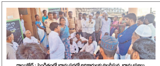
రాయికోడ్ : సింగీతంలో గ్రామ సభలో అభికారులకు నిలదీస్తున్న గ్రామ (పజలు

మునిపల్లి : పెద్దగోపులారంలో సంగారెడ్డి ఆర్డీవోను