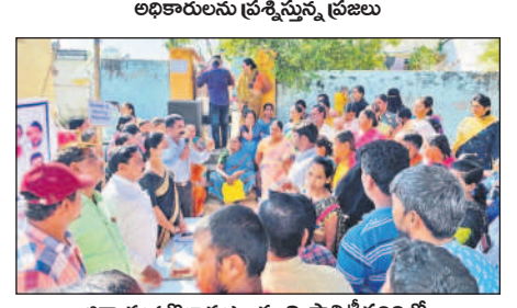
జిన్నారం (బొల్లారం) : మున్నిపారిటీ పలిభిలో అభికారులను ప్రశ్నిస్తున్న ప్రజలు