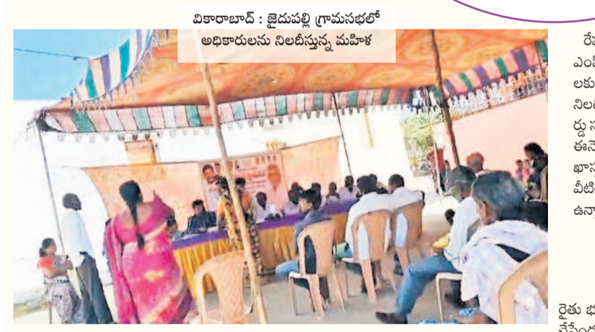
వికారాబాద్ : జైదుపల్లి గ్రామసభలో అధికారులను నిలదీస్తున్న మహిళ

రైతు భరోసా, ఆర్టీయూ భరోసా, కొత్త రేషన్ కార్డులు, ఇందిరమ్మ ఇండ్ల పథకాలకు అర్హులను ప్రదర్శించారు. తమ పేర్లు రాని ప్రజలు అధికారులను ఎక్కడికక్కడ అడ్డుకుని, నిలదీశారు. అధికారుల సూచనల మేరకు మళ్ళీ పథకాలకు దరఖాస్తులు చేసుకున్నారు. కాగా జిల్లాలో మొత్తం 924 గ్రామ, వార్డు సభలను నిర్వహించారు. ఇందిరమ్మ ఇండ్ల కోసం 48,358 మంది దరఖాస్తు చేసుకున్నారు. రేషన్ కార్డుల కోసం 1,53,000 మంది ప్రజాపాలన, మీ సేవా కేంద్రాల ద్వారా దరఖాస్తులు చేసుకోగా, గ్రామ సభల ద్వారా 73,039 దరఖాస్తులను అధికారులు స్వీకరించారు.