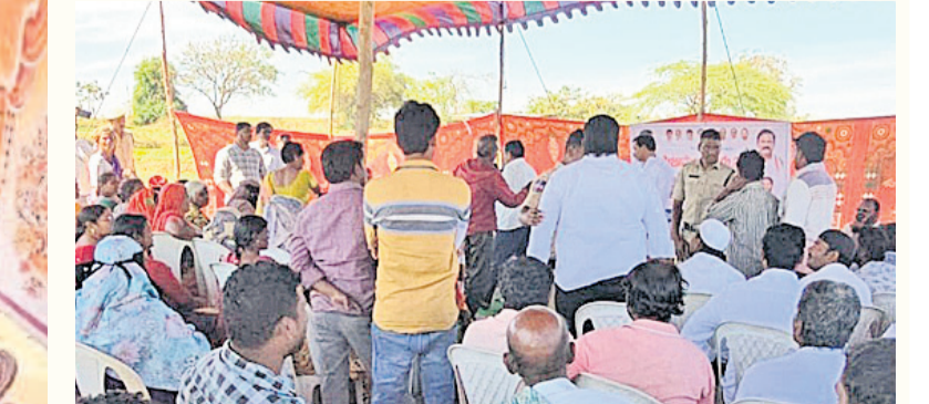
పరిగి : దరఖాస్తులు తీసుకోవడం తప్ప పథకాలు అందడం లేదని అధికారులను నిలదీస్తున్న పరిగి వదోపార్డువాసులు