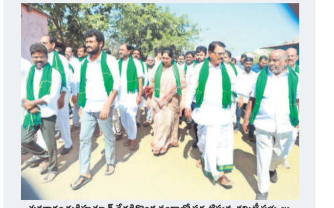
శుభవారం గుడిహత్యార్ నేరడెగొండ తండాలో పర్యటిస్తున్న కమిటీ సభ్యులు