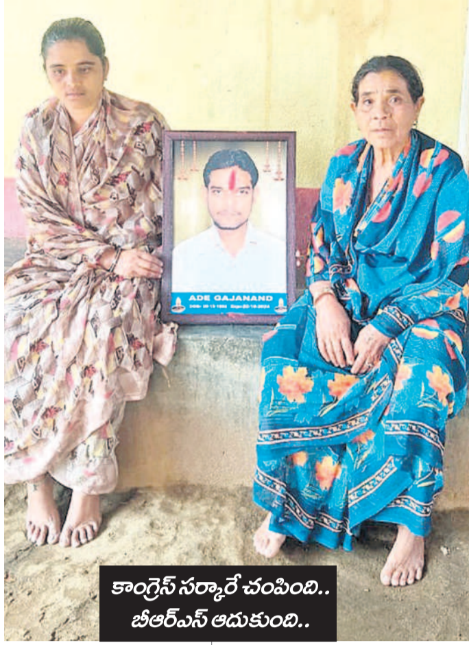
కాంగ్రెస్ సర్కారే చంపింది.. బీఆర్ఎస్ ఆదుకుంది..