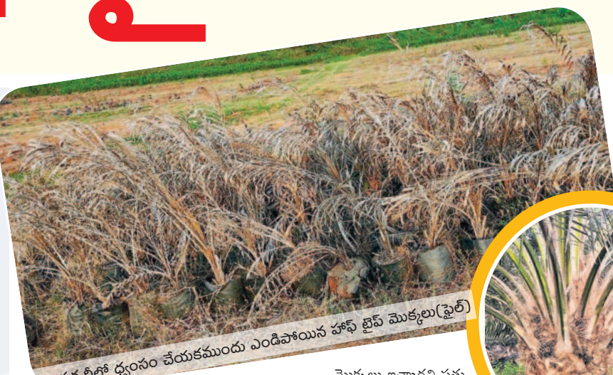
రేగళ్లపాడు సర్వీలలో ధ్వంసం చేయబడుతున్న హాఫ్ టైమ్ మొక్కలు (ఫైల్)