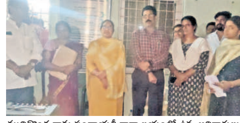
ముదిగొండ గ్రామ పంచాయతీ కార్యాలయంలో ఉన్న అధికారులు