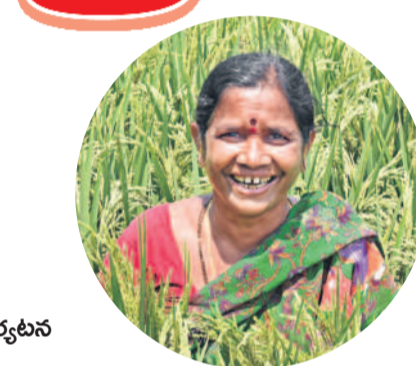
నాడు రంది లేకుండా.. నేడు భారమైంది..