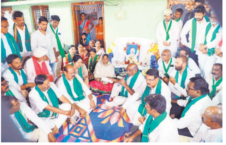
బేల మండలం లోని గుంట గ్రామంలో శుక్రవారం దేవారావు జాడవ్ కుటుంబం సభ్యులతో మాట్లాడుతున్న రైతు ఆత్మహత్యల అధ్యయన కమిటీ సభ్యులు, మాజీ మంత్రి జోగురామన్న

కాంగ్రెస్ పాలనలో దేనికీ గ్యారంటీ లేదు.. సర్కారు మారడంతో రైతులకు అందాల్సిన సంక్షేమ పథకాలకు గ్యారంటీ లేకుండా పోయింది. పథకాలు ఇయ్యకపోయినా పంట పండించేందుకు అవసరమైన కరెంటు, నీళ్లు కూడా ఇయ్యలేని పరిస్థితి దాపురించింది రైతులు వాపోతున్నారు. కాంగ్రెస్ ఇప్పటికైనా ఆరు గ్యారంటీలు దేవుడెరుగు. ఇప్పుడున్న పరిస్థితుల్లో రైతులకు ఏ విషయంలోనూ గ్యారంటీ లేకుండా పోయిందని రైతులు చెప్పారు. ● 24 గంటల కరెంటు వచ్చేది. నమ్మకం లేదు. ● పంట పెట్టుబడి సాయం లేదు. ● రుణమాఫీ అందరికీ అయితడన్న నమ్మకం లేదు. ● కాంగ్రెస్ చెప్పిన రూ. 500 కోట్లను గ్యారంటీ లేదు. ● పంటకు గిట్టుబాటు ధర వస్తదన్న నమ్మకం లేదు.