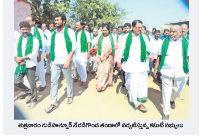
శుక్రవారం గుడిపాతూర్ నేరడీగండ్ల తండాలో పర్యటిస్తున్న కమిటీ సభ్యులు