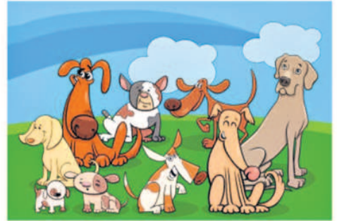
ఒకేలా కనిపిస్తున్న ఈ రెండు చిత్రాల్లో తేడాలున్నాయి. అవేంటో కనిపెట్టండి.