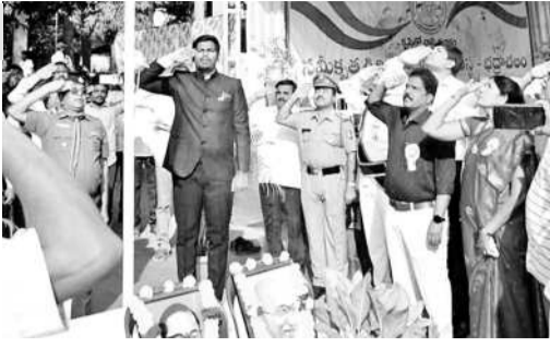
జాతీయ పతాకం ఆవిష్కరణ అంశం చేస్తున్న ఐటీడీఎ పీవో

గణతంత్ర దిన వేడుకల్లో ఐటీడీఎ పీవో రాచూర్