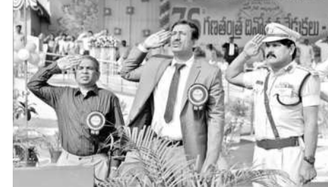
జాతీయ పతాకానికి గౌరవ వందనం చేస్తున్న సీఎంఓ