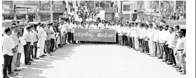
అంబేద్కర్ విగ్రహం వద్ద నిరసన తెలుపుతున్న జర్నలిస్టులు

ఖమ్మం, జనవరి 26: జర్నలిస్టుల ఇళ్ల స్థలాల కోసం గణతంత్ర దినోత్సవం రోజు ఖమ్మం నియోజకవర్గంలోని జర్నలిస్టులు కదిలివచ్చారు. మూడు దశాబ్దాల కలను సాకారం చేస్తూ రాష్ట్ర ప్రభుత్వం జారీ చేసిన జీవోను అమలు చేయాలని కోరుతూ ఖమ్మం నియోజకవర్గం నుంచి భారీ సంఖ్యలో కదిలివచ్చి ఖమ్మంలోని అంబేద్కర్ విగ్రహానికి మొర్ర మట్టుకున్నారు. ఈ సందర్భంగా జర్నలిస్టుల సంఘాల నాయకులు మాట్లాడారు. జర్నలిస్టుల హోజింగ్ సౌకర్యానికి ప్రభుత్వం 23.02 ఎకరాల స్థలాన్ని కేటాయించిందని అన్నారు. మార్కెట్ విలువ ప్రకారం ప్రభుత్వానికి నగదు చెల్లించి స్థలాన్ని