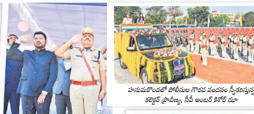
హనుమకొండలో పోలీసుల గౌరవ వందనను స్వీకరిస్తున్న కలెక్టర్ ప్రొబీడ్యో, సీపీ అంబర్ కిశోర్ రూ