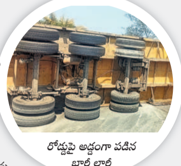
రోడ్డుపై అడ్డంగా పడిన భారీ లాల్

కరీమాబాద్, జనవరి 26 : వారంతా పాట్లకూటి కోసం ఎక్కడో సుదూర ప్రాంతం నుంచి ఇక్కడకు వచ్చి బతుకుతున్నారు. పనిచేసేందుకు మరో ప్రాంతానికి వెళ్తుండగా లాల్ డ్రైవర్ నిర్లక్ష్యం ఆ కుటుంబాన్ని చిదిమేసింది. కళ్ళ ముందే తమ కుటుంబ సభ్యుల మృతిని చూసి ఆ తల్లి గుండెలు పగిలేలా రోదించింది. ఇనుప స్తంభాల మధ్య ఉన్న తన భర్త, కూతుళ్ళను చూసి కన్నీరుమున్నుగా విలపించింది. కొనసాగింపులో ఉన్న కొడుకును తన ఒడిలో పెట్టుకొని ఆపన్న హస్తం కోసం ఎదురుచూసింది. తలలు పగిలి.. ఎముకలు విరిగి మృతదేహాలు చిద్రమయ్యాయి. ఈ ఘటనను చూసిన వారి హృదయాలు చలిచిపోయాయి. లాల్