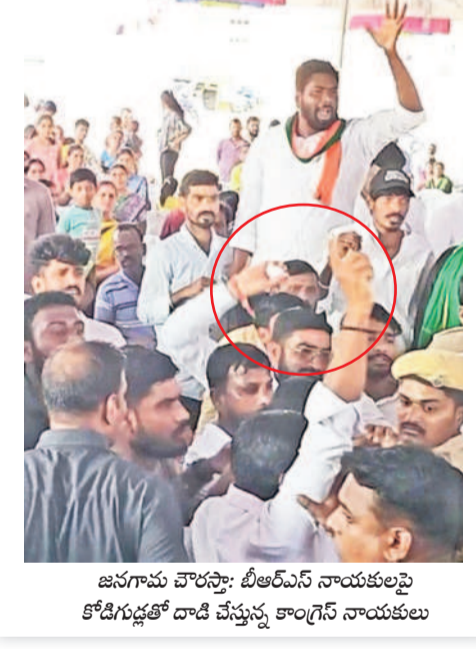
జనగామ వారసా: బీఆర్ఎస్ నాయకులపై కోడిగిద్దుతో దాడి చేస్తున్న కాంగ్రెస్ నాయకులు