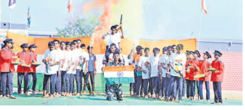
ముహూబాబాద్లో సాంస్కృతిక కార్యక్రమాల్లో పాల్గొన్న విద్యార్థులు