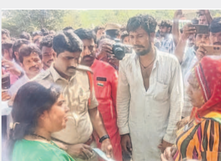
బాధిత కుటుంబ సభ్యులతో మాట్లాడుతున్న కలెక్టర్

వస్తున్న కారుకు సైతం ఇనుప స్తంభాలు తాకగా పాక్షికంగా దెబ్బతింది. ముటనా స్థలానికి చేరుకున్న పోలీసులు మృతదేహాలను మార్పూరికి తరలించి క్షతగాత్రులను ఎంజీఎం దవాఖానకు తరలించారు.