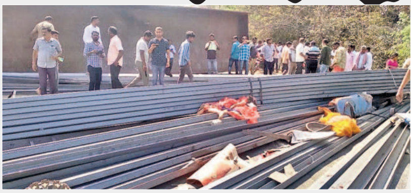
రోడ్డు ప్రమాదంలో లాల్ నుంచి రోడ్డుకు అడ్డంగా పడ్డ ఇనుప స్తంభాలు, వాటి మధ్యలో ఉన్న మృతదేహాలు