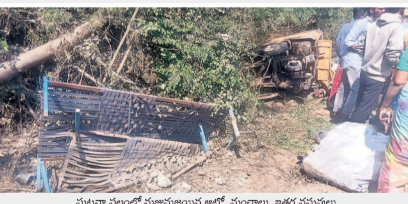
ఘటనా స్థలంలో సుజ్జనుజ్జయిన ఆటో, మంచాలు, ఇతర వస్తువులు