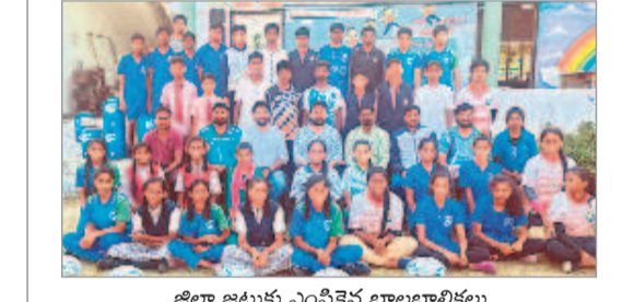
జిల్లా జట్టుకు ఎంపికైన బాలబాలికలు