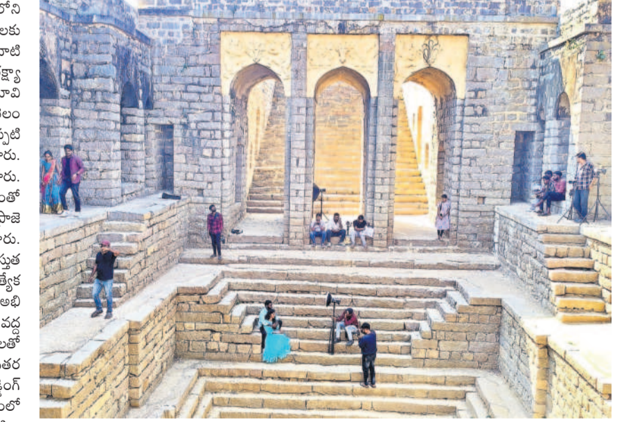
నాగన్న బావిలో ఘాటింగ్ సందడి