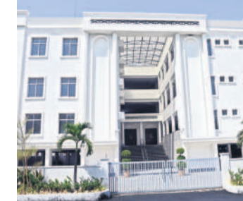
మున్సిపల్ లో 'ప్రత్యేక' పాలన