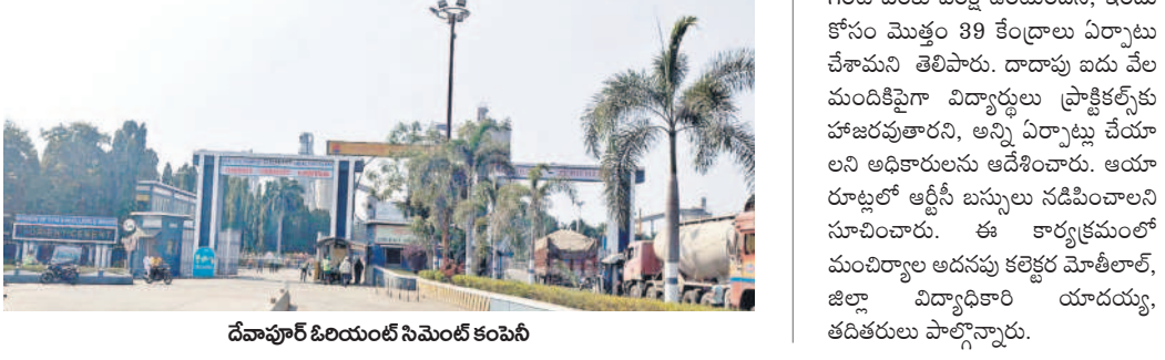
దేవపూర్ ఓరియంట్ సిమెంట్ కంపెనీ

కాసిపేట, జనవరి 28 : కాసిపేట మండలం లోని ఓరియంట్ సిమెంట్ కంపెనీ గుర్తింపు సంఘం ఎన్నికలు ఇప్పట్లే లేనట్లనా.. అంటే ఔనే సమాధానం వస్తున్నది. ఎన్నికల నిర్వహణపై ఈ నెల 28న ఫైనల్ చేస్తామని ఇటీవల జరిగిన సమావేశంలో తెలపగా, చివరకు నిరాశే మిగిలింది. ప్రస్తుతం ఓరియంట్ కంపెనీ నీ ఆదాని గ్రూపులు కొనుగోలు చేయడంతో యాజమాన్య మార్పు పట్టింది కొనసాగుతుందని, ఎన్నికలు వాయిదా వేయాలని ఓరియంట్ యాజమాన్యం ఇప్పట్లే డిమాండ్ లేబర్ కమిషనరును కోరింది. దీంతో పాటు