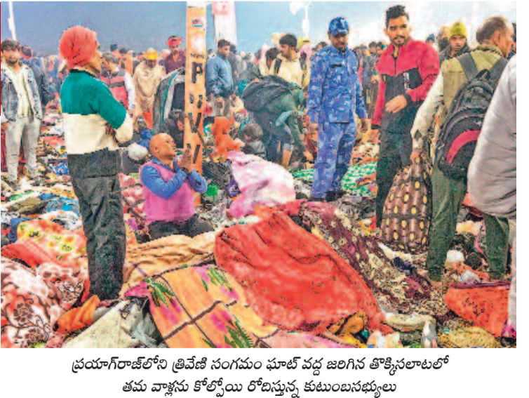
ప్రయాగరాజ్ లోని త్రివేణి సంగమం ఘాత వద్ద జరిగిన తొక్కినలాటలో తమ వాళ్లను కోల్పోయి రోదీస్తున్న కుటుంబసభ్యులు