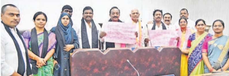
ప్లాకార్డులతో నిరసన తెలుపుతున్న బీఆర్ఎస్ కార్యకర్తలు