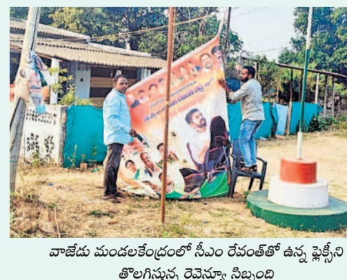
వాణేడు మండలకేంద్రంలో సీఎం రేచంద్రారెడ్డి ఉన్న ఫ్లెట్లోని తొలగిస్తున్న రెవెన్యూ సిబ్బంది

ఉపాధ్యాయ ఎమ్మెల్యే ఎన్నికల నోటిఫికేషన్ విడుదల హనుమకొండ, జనవరి 29 : సర్దోంద-వరంగల్-ఖమ్మం ఉపాధ్యాయ ఎమ్మెల్యే ఎన్నికల నోటిఫికేషన్లు ఎన్నికల సంఘం బుధవారం విడుదల చేసింది. ఇందుకు సంబంధించిన షెడ్యూల్లో ఫిబ్రవరి 3న విడుదల చేయనున్నారు. నామినేషన్ దాఖలుకు చివరి తేదీ ఫిబ్రవరి 10, నామినేషన్ పునరీక్షల ఫిబ్రవరి 11, ఉపసంహరణకు గడువు 13, ఫిబ్రవరి 27 ఉదయం 8గంటల నుంచి సాయంత్రం 4గంటల వరకు పోలింగ్, మార్చి 3న ఓట్లు లెక్కింపు ఉంటుంది. మార్చి 8వ తేదీ వరకు ఎన్నికల ప్రక్రియ అంతా పూర్తివుతుంది. ఎమ్మెల్యేగా నర్సంపేట కౌన్సిలర్ గుర్రాపాటి 29శాతం పదవీ కాలం ముగియనున్నది. కాగా ఎమ్మెల్యే ఎన్నిక కోసం హనుమకొండ జిల్లా పరిధిలో మొత్తం 15 పోలింగ్ స్టేషన్లను గుర్తించారు. 5,098 మంది ఓటర్లు ఉండగా పురుషులు 2,884, మహిళలు 2,214 మంది ఉన్నారు. వీరలూ ఫిబ్రవరి 27న ఓటు హక్కు వినియోగించుకోవచ్చు. అయితే ఓటు సమయం చేసుకోనేందుకు అంతా అవకాశం ఉన్నందున ఓటర్ల సంఖ్య పెరిగి అవకాశం ఉందని కలెక్టరేట్ ఎన్నికల విభాగం అధికారులు తెలిపారు.