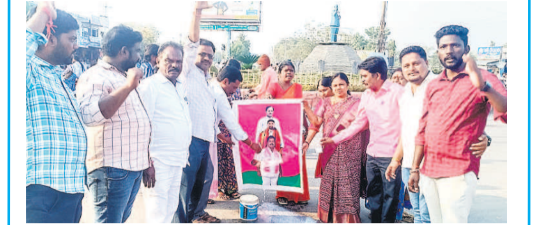
చుజారాబాద్ టౌన్: కేసీఆర్, పాడి కౌశిక్ రెడ్డి ప్లేట్ కి పాలాభిషేకం చేస్తున్న బీఆర్ఎస్ నాయకులు

దళిత బంధుత్వం ఆంక్షలు ఎత్తివేత పట్టకలకు కాంగ్రెస్ సర్కారు దిగివచ్చింది. తెలంగాణ తొలి ముఖ్యమంత్రి కేసీఆర్ ప్రతిష్టాత్మకంగా అమలు చేసిన దళిత బంధుత్వంపై తన వైఖరిని మార్చుకున్నది. దళితుల నిరంతర పోరాటాలు, చుజారాబాద్ ఎమ్మెల్యే పాడి కౌశిక్ రెడ్డి చట్ట సభలు, సమీక్షా సమావేశాల్లో గళమెత్తిన నేపథ్యంలో ప్రభుత్వం పద్నాలుగు నెలలుగా ఖాతాలపై విధించిన ఆంక్షలను ఎత్తివేసింది. పోలీసుల నిర్బంధాలు, అనేక అడ్డంకులను ఎదుర్కొంటూ చుజారాబాద్ దళితులు చేసిన పోరాటంతో రాష్ట్రంలోని దళితులకు న్యాయం జరిగినట్లుంది. దళిత బంధుత్వ ఖాతాలపై ప్రీజింగ్ తీసుకువచ్చి నియోజకవర్గంలోని 8,148 మంది దళిత కుటుంబాలకు రెండో విడుదల సాయం అందబోతుండగా, ప్రభుత్వ అధికారులతో యంత్రాంగం కనరత్న ప్రారంభించేందుకు సిద్ధమవుతున్నది.