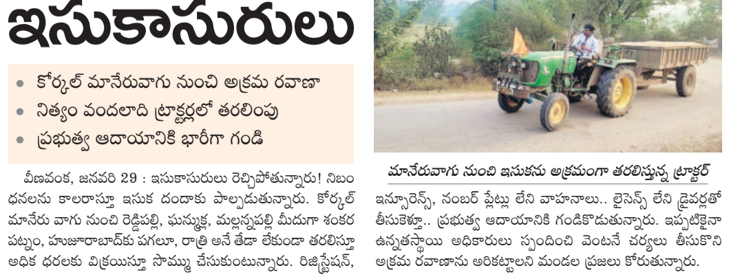
మానేరువారు నుంచి ఇసుకను అక్రమంగా తరలిస్తున్న ట్రాక్టర్

ఇసుకాసురులు కోర్కల్ మానేరువారు నుంచి అక్రమ రవాణా నిత్యం వందలాది ట్రాక్టర్ల తరలింపు ప్రభుత్వ ఆదాయానికి భారీగా గండి వీణవంక, జనవరి 29 : ఇసుకాసురులు రెచ్చిపోతున్నారు! నిలబడనలను కాలరాస్తూ ఇసుక దండం పాల్పడుతున్నారు. కోర్కల్ మానేరు వారు నుంచి రెడ్డిపల్లి, ఘనపల్లి, మల్లన్నపల్లి మీదుగా శంకర పట్నం, చుజారాబాద్ వగలూ, రాతి అనే తీరా లేకుండా తరలిస్తూ అధిక దరలకు విక్రయం సూచిస్తున్నారని తెలుస్తున్నది. రిజిస్ట్రేషన్, మానేరువారు నుంచి ఇసుకను అక్రమంగా తరలిస్తున్న ట్రాక్టర్ ఇన్సూరెన్స్, సంబంధ ప్లేట్ల లేని వాహనాలు.. లైసెన్స్ లేని డ్రైవర్లతో తీసుకెళ్తున్నారు. ప్రభుత్వ ఆదాయానికి గండికొడుతున్నారు. ఇప్పటికైనా ఉన్నతస్థాయి అధికారులు స్పందించి వెంటనే చర్యలు తీసుకోని అక్రమ రవాణాను అరికట్టాలని మండల ప్రజలు కోరుతున్నారు.