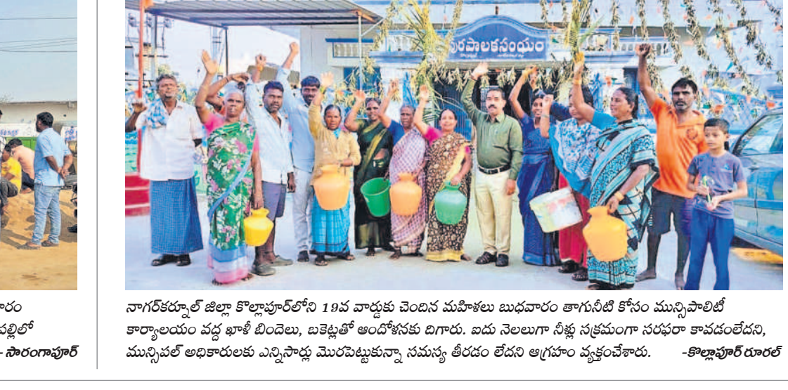
నాగర్ కర్నూల్ జిల్లా కొల్లూపూర్ లోని 19వ వార్డుకు చెందిన మహిళలు బుధవారం తాగునీటి కోసం మున్సిపాలిటీ కార్యాలయం వద్ద భాల్షీ బిందెలు, బియ్యంతో ఆందోళనకు దిగారు. ఐదు నెలలుగా నీళ్లు సక్రమంగా సరఫరా కావడంలేదని, మున్సిపల్ అధికారులకు ఎన్నిసార్లు మొరపెట్టుకున్నా సమస్య తీరడం లేదని ఆగ్రహం వ్యక్తం చేశారు. - కొల్లూపూర్ డాలర్