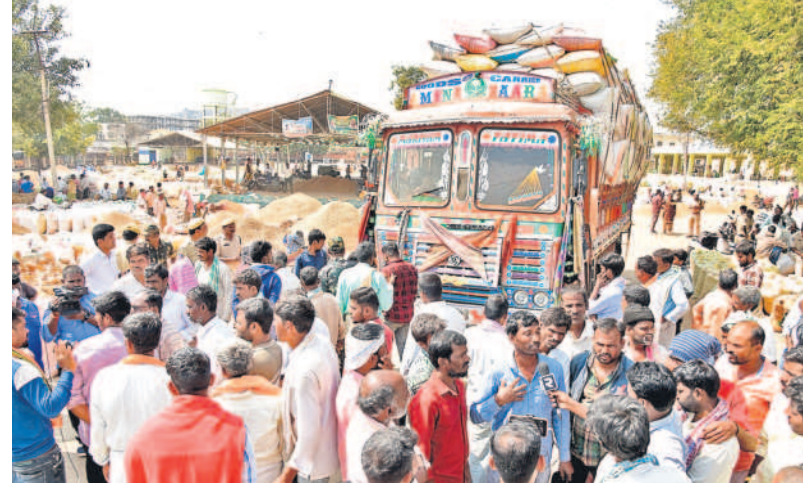
మహబూబ్ నగర్ మార్కెట్లో ఇస్తామన్న ధర ఇవ్వాలని ఆందోళనకు దిగిన పల్లి రైతులు