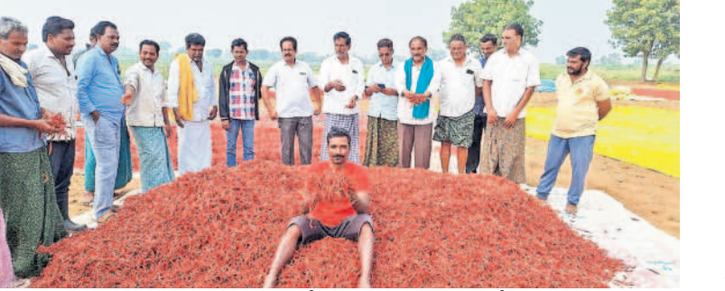
ఖమ్మం జిల్లా వైరాలోని లాలాపురం వద్ద కల్లంలో మిర్చిని మాడిస్తూ నిరసన తెలుపుతున్న రైతు సంఘం నాయకులు, రైతులు