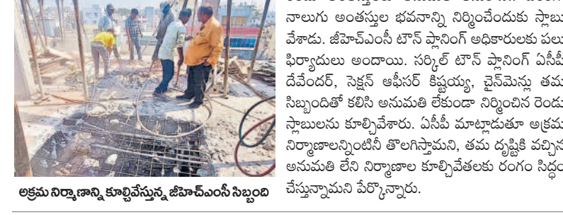
అక్రమ నిర్మాణం కూల్చివేస్తున్న జీహెచ్ఎస్ఐ సిబ్బంది

అక్రమ నిర్మాణాలపై ఉక్కుపాదమే సిటీబ్యూరో: జీహెచ్ఎస్ఐ పరిధిలో అక్రమ నిర్మాణాలపై కఠినంగా వ్యవహరించేందుకు టౌన్ ప్లానింగ్ విభాగం సిద్ధమైంది. అక్రమ నిర్మాణాలను ఎట్టి పరిస్థితుల్లో ఉపేక్షించవద్దని, బాధ్యులపై కఠినంగా వ్యవహరించాలని ఇటీవల సుప్రీంకోర్టు కీలక తీర్పును వెలువరించింది. అధికారుల్లో జవాబు దారితనంతో పాటు పట్టు ప్రణాళిక చట్టాన్ని పక్కనపెట్టే అవకాశం సూచించింది. ఈ నేపథ్యంలో సుప్రీం జిటిఎన్ 295, అక్టోబర్ 2014లో ప్రకారం తీర్పు ప్రకారం న్యాయస్థానం విధి విధానాలను పక్కాగా అమలు చేయాలని కమిషన్ ఇంటిగ్రేటెడ్ నిర్ణయించారు. ఈ మేరకు బుధవారం సుప్రీం కోర్టు తీర్పు ఆదేశాలను అక్రమ నిర్మాణ నియంత్రణలో ప్రత్యేక గ్రేడ్ లైస్సెన్స్ విడుదల చేసే పక్కాగా అమలు చేయాలని టౌన్ ప్లానింగ్ విభాగం అధికారులకు ఉత్తర్వులు ద్వారా ఆదేశాలు జారీ చేశారు.