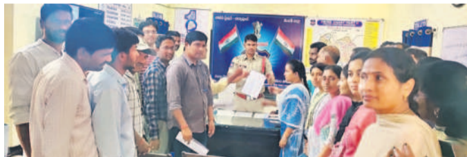
ఎస్సెక్ ఫిర్యాదు చేస్తున్న పంచాయతీ కార్యదర్శులు

నర్సాపూర్, జనవరి 29: గ్రామసభల్లో గతంలో జక్రపలి, నత్తూరుపల్లి, లింగా ప్రజల నుంచి భద్రత కల్పించాలని మండలంలోని పలు గ్రామాలకు చెందిన పంచాయతీ కార్యదర్శులు బుధవారం ఎస్సెక్ లింగంపేటకు ఫిర్యాదు చేశారు. గ్రామసభల్లో ప్రజలు ప్రభుత్వ పథకాల గురించి అసభ్య పదజాలంతో తమను దూషిస్తున్నారని, వారి నుంచి భద్రత కల్పించాలని పంచాయతీ కార్యదర్శులు, ఎంపీవో కలిసి తమకు ఫిర్యాదు చేసినట్లు ఎస్సెక్ లింగం తెలిపారు.