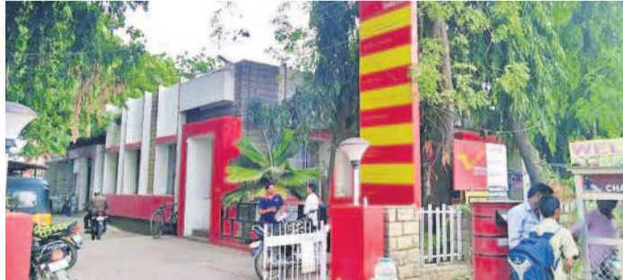
సంగారెడ్డి పట్టణంలోని పోస్టాఫీసు

కౌంటర్లను సౌత్ సెంట్రల్ రైల్వే ఎత్తివేసేందుకు సిద్ధమైంది, త్వరలోనే ఉత్తర్వులు వెలువడనున్నట్లు తెలిసింది. ఇది వరకే సంగారెడ్డి, జోగిపేట పోస్టల్ సబ్ డివిజన్ల ద్వారా నిర్వహిస్తున్న రైల్వే టికెట్ బుకింగ్ సేవలను రైల్వే శాఖ నిలిపివేసింది. దీంతో రైలు ప్రయాణికులు అన్లైన్ లో టికెట్లు కొనుగోలు చేస్తున్నారు. ఆన్లైన్ రైలు ప్రయాణానికి దక్షిణ మధ్య రైల్వే అధికారులు ఆ కౌంటర్లను ఎత్తివేసారు. రైల్వే రిజర్వేషన్ కౌంటర్ల కోసం సంగారెడ్డి ప్రజలు లింగం తిరిగి డిమాండ్ చేయడంతో పోస్టాఫీసుల్లో రైల్వే శాఖ మొదటి నుంచి సంగారెడ్డి జిల్లాపై శీతకన్య చూపుతున్నది. సంగారెడ్డి జిల్లాలో జిహోరాబాద్ మీదుగా రైల్వేలైన్ ఉంది. సంగారెడ్డి, జోగిపేట, నారాయణ ప్రాంతం గుండా సంగారెడ్డిలో రైల్వే రిజర్వేషన్ కౌంటర్లను కాంటాం డిమాండ్ చేస్తున్నారు. కేంద్రంలో ఏ దీంతో చాలామంది ప్రయాణికులు అదనంగా డబ్బులు వెచ్చించి ట్రావెల్ ఏజెంట్ల ద్వారా