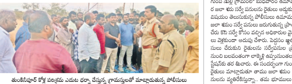
తుంకినీపూ కోళ్ల పరిశ్రమ ఎదురు ధర్మా చేస్తున్న గ్రామస్థులతో మాట్లాడుతున్న పోలీసులు

● తుంకినీపూ డాన్సుల ధర్మా మూసాపేట, జనవరి 29 : మండలంలోని తుంకినీపూ డాన్సుల కోళ్ల పరిశ్రమను తొలగించాలని గృహాలని బుధవారం గ్రామస్థులు ఆ పరిశ్రమ ఎదురు నిరసన తెలుపుతూ గ్రామస్థులు ఆ పరిశ్రమను తొలగించాలని డిమాండ్ చేసి ధర్మా నిర్వహించారు. కోళ్ల పరిశ్రమను తొలగించాలని పంట పొలాలు ఉంటాయి. పంట పొలాలు కావాలని వ్యాపారులు అంటున్నారు. రోజూ మందిరికీ మంగళవారం రాత్రి పంట పొలాలు కావాలని వ్యాపారులు డిమాండ్ చేస్తున్నారని అంటున్నారు. అదేవిధంగా కోళ్ల పరిశ్రమను తొలగించాలని వ్యాపారులు అంటున్నారు. రైతులకు కీడు చేసే కంపెనీ ఏర్పాటు చేయవద్దన్నారు. అలాంటిది బంగారు పంటలు