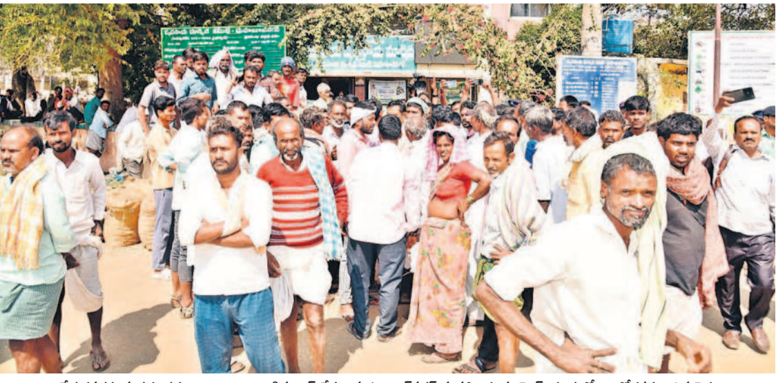
వేరుశనగకు మద్దతు ధర పెంచి ఇవ్వాలని డిమాండ్ చేస్తూ మహబూబ్ నగర్ వ్యవసాయ మార్కెట్ యార్డులో ఆందోళనకు దిగిన రైతులు

● మంటల్లో కాల్చిపోయి 10 క్వీంటాళ్ల ఎర్ర బంగారం అయిజ, జనవరి 29 : మండలంలోని టీటీడెడ్డి గ్రామంలో ఓ రైతు ఎండు మిర్చి బస్తాలకు నిప్పు ఉరికి తీసి ప్రధాన సర్కారు యే పంట అలభ్యంగా వెలుగుతో పట్టణం చేరుకుంది. మండలంలోని టీటీడెడ్డి గ్రామానికి చెందిన రైతు