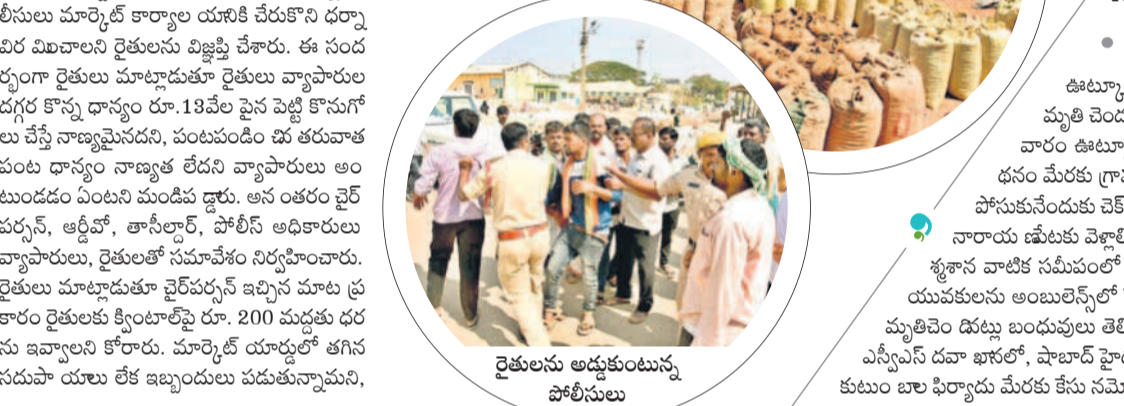
పాలమూరులో రైతులను అడ్డుకుంటున్న పోలీసులు

పాలమూరు, జనవరి 29 : మహబూబ్ నగర్ మార్కెట్ యార్డులో రైతులు బుధవారం కూడా వ్యవసాయ మార్కెట్ కార్యాలయాన్ని ముట్టడించి ఆందోళన నిర్వహించారు. రైతులు గత రాత్రి మంగళవారం మార్కెట్ కమిటీ చైర్మన్ చెప్పిన ప్రకారం క్వీంటాళ్ల రూ.200 ధర పెంచాలని కోరారు. వ్యాపారులు మాకు రూ.200 పెంచితే మాకు భారం పడుతుంది అంటున్నారు. రైతులు బుధవారం మరోసారి వ్యవసాయ కార్యాలయాన్ని ముట్టడించి ఆందోళన నిర్వహించారు. విషయం తెలుసుకున్న పోలీసులు మార్కెట్ కార్యాలయం దగ్గర వచ్చి విరమించారు. రైతులను విజ్ఞప్తి చేశారు. ఈ సందర్భంగా రైతులు మాట్లాడుతూ రైతుల వ్యాపారుల దగ్గర కొన్ని ధాన్యం రూ.13 వేల పైన పెట్టే కొనుగోలు చేసే నాణ్యమైన పంట, పంటలకు డిమాండ్ తగ్గినప్పుడు పంట ధాన్యం నాణ్యత లేదని వ్యాపారులు అంటుండడం ఏంటని మండిపడ్డారు. అనంతరం చైర్మన్, అడ్మిన్, డిమాండ్, పోలీస్ అధికారులు వ్యాపారులు, రైతులతో సమావేశం నిర్వహించారు. రైతుల మాట్లాడుతూ చైర్మన్ రైతుల మాటల ప్రకారం రైతులకు క్వీంటాళ్ల రూ. 200 మద్దతు ధరను ఇవ్వాలని కోరారు. మార్కెట్ యార్డులో తగిన సదుపాయాలు లేక ఇబ్బందులు పడుతున్నామని,