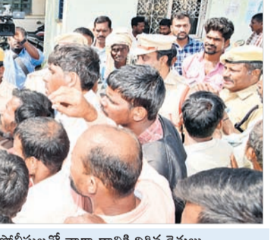
పోలీసులతో వాగ్వాదానికి దిగిన రైతులు