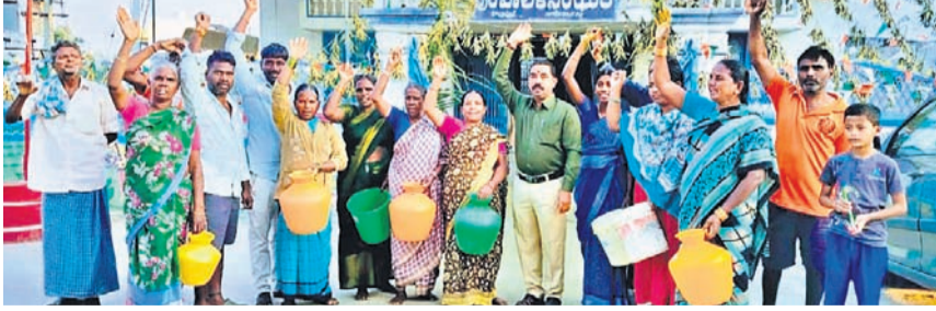
ఖాళీ బిందెలతో మునిపాలిలో కార్యాలయం ఎదురు నిరసన తెలుపుతున్న ప్రజలు

కొల్లా పూర్ రూరల్, జనవరి 29 : కొల్లా పూర్ మున్సిపాలిటీలోని పలు వార్డుల్లో తాగునీటి సమస్యను పరిష్కరించాలని మహిళలు డిమాండ్ చేశారు. ఈ మేరకు బుధవారం కొల్లా పూర్ మున్సిపల్ కార్యాలయం ఎదురు నిరసన వ్యక్తం చేసిన మహిళా శుభ్ర బిందెలతో ధర్మా నిర్వహించారు. ఈ సందర్భంగా మహిళా శుభ్ర బిందెలతో పట్టణంలో గత ఇరుగు దూరు తాగునీటి సమస్యను పరిష్కరించే దిశగా చర్యలు తీసుకుంటామని, సమస్యను పరిష్కరించాలని పలుమార్లు అధికారులకు విన్నవించినా పట్టణంలో పరిస్థితి మారలేదని ఆరోపించారు. నెలలగా చేతివేసి పుణ్యం చేయాలని నీటితోనే కాలం వెళ్లొచ్చిందని, వేసవిలో పరిస్థితి మరింత దారుణంగా ఉంటుందని ఇప్పటికే అధికారులు చర్యలు తీసుకోవాలని డిమాండ్ చేశారు. మున్సిపల్ కమిషనర్ కు వివరణ కోరగా, పట్టణంలో ఎక్కడ తాగునీటి సమస్య ఉందో గుర్తించి పరిష్కరించే దిశగా చర్యలు తీసుకుంటామని చెప్పారు.