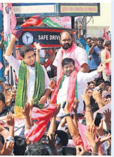
గులాబీ బెంగా ఊపుతూ కార్యకర్తలకు అభివాదం చేస్తున్న మాజీ మంత్రిలు కేటీఆర్, జగదీశ్ రెడ్డి (ఫైల్)

స్వచ్ఛందంగా పెద్దఎత్తున తరలివచ్చిన రైతులు ప్రభుత్వంపై కట్టలు తెంచుకున్న వ్యతిరేకత బీఆర్ఎస్ శ్రేణుల్లో నూతనోత్తేజం ఫలించిన మాజీ మంత్రి జగదీశ్ రెడ్డి వ్యూహం