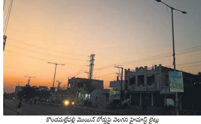
కొండమల్లపల్లి మొయిన్ రోడ్డుపై వెలగం హైమాస్టర్ లైట్లు

కాంగ్రెస్ నేతలు ఇచ్చిన 420 అబద్ధపు హామీలు, ఆరు గ్యారంటీలతో ఉమ్మడి నల్లగొండ జిల్లాలో 11 స్థానాలను గెలుచుకున్న కాంగ్రెస్ పై ఏడాది కాలంలోనే తిరుగుబాటు మొదలైంది. ఎన్నికల సమయంలో రైతులకు రెండు లక్షల రుణమాఫీ, రైతు భరోసా కింద ఎకరాకు రూ.15వేలు ఇస్తామని చెప్పిన కాంగ్రెస్ సర్కార్ ఏడాదిగా అమలు చేయకపోవడంతో రైతులు తీవ్ర ఇబ్బందులు పడుతున్నారు. కేటీఆర్ పాలనలో క్రమం తప్పకుండా అందిన రైతుబండ్లు, రుణమాఫీని గుర్తు చేసుకుంటున్నారు. కేటీఆర్ పాలనే బాగుందని చెప్పుకొంటున్నారు. ఈ క్రమంలో మంగళవారం నల్లగొండలో నిర్వహించిన రైతు ధర్మాకు మంచి స్పందన లభించింది. బీఆర్ఎస్ వర్కింగ్ ప్రెసిడెంట్ కేటీఆర్ పిలుపు మేరకు రైతులు పెద్ద సంఖ్యలో తరలి రావడంతో బీఆర్ఎస్ శ్రేణుల్లో ఉత్సాహం నిండింది. ఉమ్మడి జిల్లావ్యాప్తంగా బీఆర్ఎస్ మాజీ ఎమ్మెల్యేల పిలుపు కూడా తోడవడంతో రైతుల గొండ్లం పెద్ద ఎత్తున కదిలింది. ఈ క్రమంలో మాజీ మంత్రి, సూర్యాపేట ఎమ్మెల్యే గుంటకండ్ల జగదీశ్ రెడ్డి వ్యూహం పూర్తిగా సఫలమైంది.