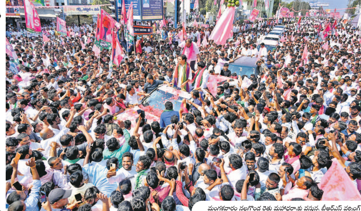
మంగళవారం నల్లగొండ రైతు మహాధర్మాకు వస్తున్న బీఆర్ఎస్ వర్కింగ్ ప్రెసిడెంట్ కేటీఆర్ కు స్వాగతం పలికిన రైతులు, అభిమానులు (ఫైల్)

పాఠశాల పురిటి గడ్డ నల్లగొండ తాజాగా బీఆర్ఎస్ పార్టీ రైతుల పక్షాన నిర్వహించిన మహాధర్మాతో గులాబీమయం అయ్యింది. రైతులకు ఇచ్చిన హామీలను అమలు చేయకుండా కాంగ్రెస్ పార్టీ చేస్తున్న కుట్రలను ఖండిస్తూ బీఆర్ఎస్ వర్కింగ్ ప్రెసిడెంట్ కేటీఆర్ సమర శంఖం పూరించగా రైతులోకం కదిలివచ్చింది. ఈ సందర్భంగా మంగళ వారం నాటి మహాధర్మా సమయంలో క్లాక్ టవర్ సెంటర్ ఇసుకేన్సీ రాలనంతగా కిక్కిరిసింది. రైతు సమస్యలపై ముందుండి పోరాడడానికి వచ్చిన కేటీఆర్ కు నల్లగొండ ఘన స్వాగతం పలికింది. ఊహించని స్థాయిలో రైతులు స్వచ్ఛందంగా తరలి రాగా, మాజీ మంత్రి జగదీశ్ రెడ్డి నేతృత్వంలో చేపట్టిన రైతు మహా ధర్మా గ్రాండ్ సక్సెస్ అయింది. ఇది బీఆర్ఎస్ ప్రేమలో నూతనోత్తేజాన్ని నింపింది.