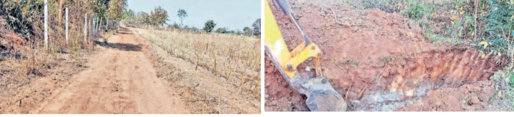
రాష్ట్రంలో అటవీ భూముల్లోకి వెళ్ళడానికి ఏర్పాటు చేసుకున్న రోడ్డు. రోడ్డు మార్గంలో ఎవరూ వెళ్ళకుండా ఏర్పాటు చేసిన కండ్లం