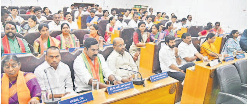
సమావేశానికి హాజరైన మంత్రి కొండా సురేఖ, ఎమ్మెల్యేలు పోచంపల్లి శ్రీనివాసరెడ్డి, సారయ్య, ఎంపీ కడియం కావ్య, ఎమ్మెల్యేలు నాయిని, నాగరాజు

నగర వీలిన గ్రామాల రైతు కూలీలకు ఇందిరమ్మ ఆత్మీయ భరోసా వర్ణంపజేయాలి. లక్షలాది మంది భరోసా అందక స్వప్నావుతున్నారని. నగర రైతు కూలీలకు భరోసా అమలు చేసే వరకు పోరాడుతాం. కాంగ్రెస్ పాలక వర్గం నగరాభివృద్ధికి చేసిందేమీ లేదు. కొన్ని సమావేశం సీఎం రేపంపెట్టె పొగడ్డలతో సరిపోయింది. బీఆర్ఎస్ కార్కొరేటర్లకు ప్రాబోకార్ పాటింపకుండా అధికారులు అవమానిస్తున్నారు. ప్రాబోకార్ ఉల్లంఘిస్తే ఊరుకోం. విపక్ష కార్కొరేటర్ల డివిజన్లకు నిధులు కేటాయింపకుండా విపక్ష చూపుతున్నారని. కేసీఆర్, కేటీఆర్ నాయకత్వంలో పోరాడుతాం.