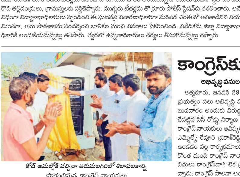
కోడ్ అమల్లోకి వచ్చినా తిరుమలగిరిలో శిలాఫలకాన్ని ప్రారంభిస్తున్న కాంగ్రెస్ నాయకులు