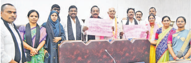
ప్లాకార్డులతో నిరసన తెలుపుతున్న బీఆర్ఎస్ కార్కొరేటర్లు