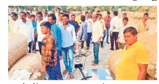
ఒక్కరోజులోనే పత్తి ధరను క్వింటాలుకు రెండు వేలు తగ్గించడంపై నిరసనపై మద్దతు తెలిపిన మార్కెట్ అండ్ ట్రేడింగ్ కమిషన్

రెండు రోజుల్లో 2 వేలు ధర తగ్గించడంపై ఆగ్రహం ధర పెంచాలని ఆందోళన.. రాజీవ్ రహదారిపై ధర్నా