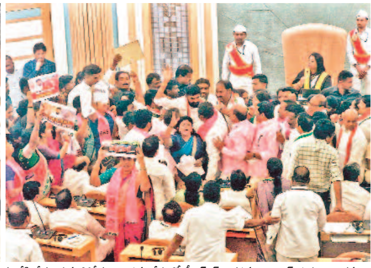
జీహెచ్ఎంసీ పాలకమండలి భేటీ నుంచి బీఆర్ఎస్ కార్యకర్తలను అడ్డు వేసి తీసుకెళ్లిన పోలీసులు.. సమావేశంలో బీఆర్ఎస్ నిరసనపై కాంగ్రెస్ నభ్యుల దౌర్భాగం