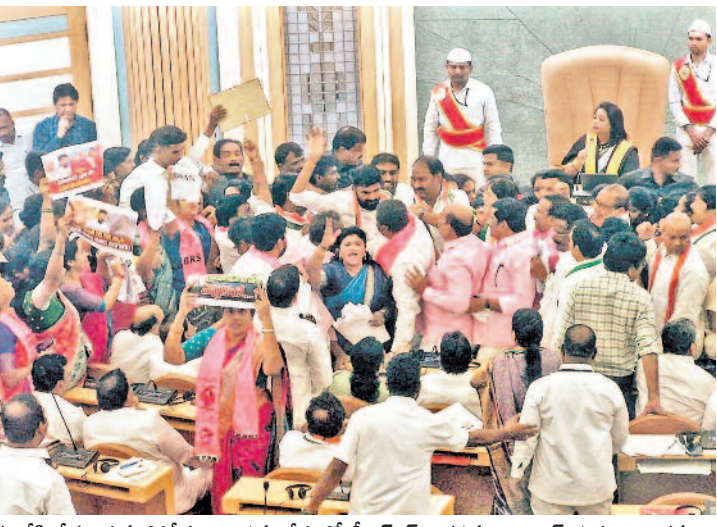
జీహెచ్ఎంసీ పాలకమండలి భేటీ నుంచి బీఆర్ఎస్ కార్యకర్తలను అరెస్టు చేసి తీసుకెళ్తున్న పోలీసులు.. సమావేశంలో బీఆర్ఎస్ నిరసనపై కాంగ్రెస్ నభ్యుల దౌర్భాగం