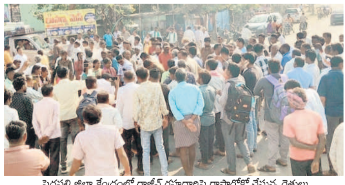
పెద్దపల్లి జిల్లా కేంద్రంలో రాజీవ్ రూరాలాపి రాస్ట్రాలో చేస్తున్న రైతులు