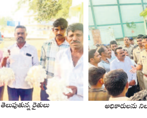
పత్తిలో నిరసన తెలుపుతున్న రైతులు