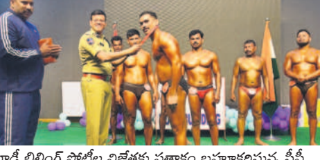
బాడీ బిల్డింగ్ పోటీల విజేతలకు పతాకం బహుమతిస్తున్న సీపీ