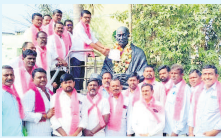
మంధనిలో గాంధీ విగ్రహానికి వినతిపత్రం అందిస్తున్న పుట్ట మధూకర్