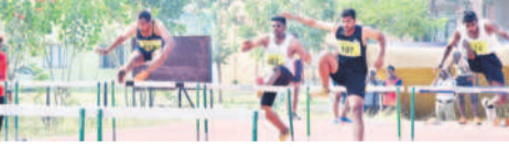
హోరన్ జంట్లో పాల్గొన్న క్రీడాకారులు