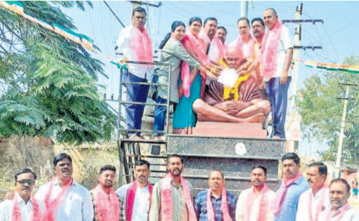
సిరిసిల్లా రూరల్: తగిరంపల్లిలో గాంధీ విగ్రహానికి వినతిపత్రం అందిస్తున్న బీఆర్ఎస్ నేతలు

హామీల అమలు కోసం బీఆర్ఎస్ దశం మరోసారి పోరుబాట పట్టింది. కాంగ్రెస్ అధికారంలోకి వచ్చి 420 రోజులు అవుతున్నా ఇచ్చిన 420 హామీలు అమలు చేయడం లేదని నిలదీసింది. పార్టీ వర్కింగ్ ప్రెసిడెంట్ కేటీఆర్ పిలుపుతో గురువారం ఉమ్మడి జిల్లావ్యాప్తంగా నాయకులు నిరసనలు తెలిపారు. జాతిపిత మహాత్మాగాంధీ వర్ణం సంకర్షణగా నియోజకవర్గ కేంద్రాలు, మండల కేంద్రాల్లో ఆయన విగ్రహాలకు వినతి పత్రాలు అందించారు. ఎన్నికల ముందు కాంగ్రెస్ 420 హామీల పేరిట ప్రజలను మోసం చేసిందని, అధికారంలోకి వచ్చి 420 రోజులు గడిచినా అమలు చేయకుండా వదిలివేసి ధ్వజమెత్తారు. కాంగ్రెస్ పార్టీ ఇచ్చిన ఏ ఒక్క హామీని పూర్తి స్థాయిలో అమలు చేయడం లేదని మండిపడ్డారు. ప్రజలను నమ్మించి దగా చేసిన ఈ అసమర్థ ప్రభుత్వం కళ్ళ తెలివించాలని, హామీలు నెరవేర్చేలా బుద్ధిని ప్రసాదించాలని మహాత్మాగాంధీని వేడుకున్నారు. కాంగ్రెస్ ప్రధానంగా రైతులు మోసం చేసిందని, రుణమాఫీ, రైతుభరోసా అందించడంలో పూర్తిగా విఫలమైందని స్పష్టం చేశారు. కాంగ్రెస్ ఇచ్చిన ప్రతి హామీని అమలు చేసే వరకు ప్రజల పక్షాన నిలిచి పోరాటాలు చేస్తామని హెచ్చరించారు. ప్రభుత్వం మేడలు వదిలి హామీలు అమలు చేసేలా చేస్తామని స్పష్టం చేశారు. - రాజన్న సిరిసిల్లా, జనవరి 30 (నమస్తే తెలంగాణ)