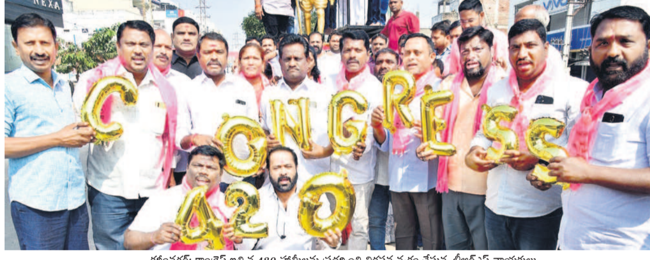
కరీంనగర్: కాంగ్రెస్ ఇచ్చిన 420 హామీలను ప్రదర్శించి నిరసన వ్యక్తం చేస్తున్న బీఆర్ఎస్ నాయకులు