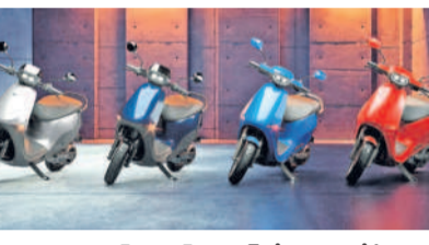
తీర్చిదిద్దిన మూడల్ సింగిల్ చార్జింగ్తో 320 కిలోమీటర్ల ప్రయాణం చేయగలగిన అలాగే 4 కిలోవాట్ బ్యాటరీ కలిగిన మూడల్ సింగిల్ చార్జింగ్తో 242 కిలోమీటర్ల దూరం వెళ్లగలగలనున్నాయి.

న్యూఢిల్లీ, జనవరి 31: ఎలక్ట్రిక్ స్కూటర్ల తయారీ ఓలా స్టూడియో పెంచింది. ఒకేరోజు ఎనిమిది రకాల స్కూటర్లను మార్కెట్లోకి పరిచయం చేసింది. ఎన్1 ట్రాండ్తో విడుదల చేసిన ఈ స్కూటర్లు రూ. 79,999 మొదలకొని రూ. 1,69,999 గరిష్ట ధరతో లభించనున్నాయి. జనవరి 31 ఫ్లాట్ ఫాలోంగా భాగంగా అభివృద్ధి చేసిన ఈ స్కూటర్లు వినియోగదారుల అభిరుచికి తగ్గట్టుగా తీర్చిదిద్దిన ధ్వని డిజైన్లను వెల్లడించాయి. ఎన్1 ఎక్స్, ఎన్1 ఎక్స్+, ఎన్1 ట్రా, ఎన్1 ట్రా+ పేర్లతో నాలుగు రకాల స్కూటర్లను తెచ్చింది. వీటిలో 5.3 కిలోవాట్ బ్యాటరీతో