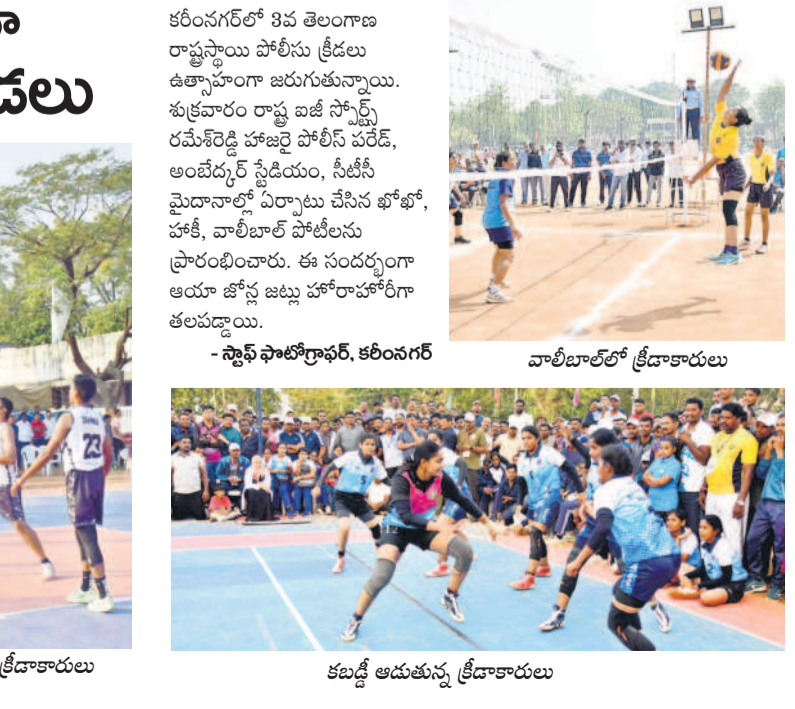
వాలీబాల్ లో క్రీడాకారులు కబడ్డీ ఆడుతున్న క్రీడాకారులు