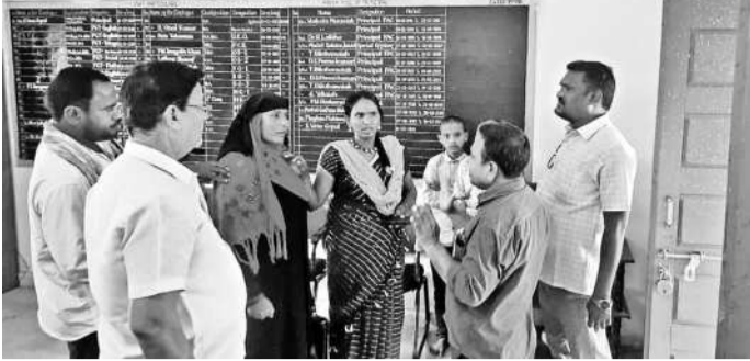
ఉపాధ్యాయులను నిలదీస్తున్న విద్యార్థుల తల్లిదండ్రులు