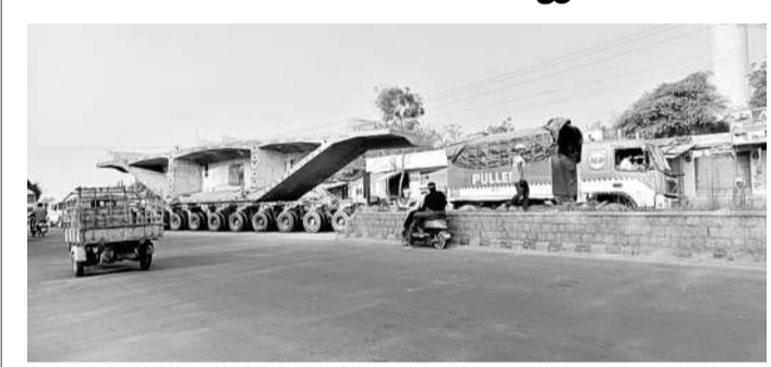
భారీ లారీపై బ్రడ్లీ తరలిస్తున్న దృశ్యం

ఖమ్మం రూరల్, జనవరి 31: సాధారణంగా ఎక్కడైనా బ్రడ్లీలపై లారీలు వెళుతుంటాయి. కానీ ఇక్కడ చూస్తే ఏకంగా లారీపైనే బ్రడ్లీ వెళ్తోంది. ఈ దృశ్యాన్ని చూసిన స్థానికులు ఆశ్చర్యం వ్యక్తం చేశారు. గతంలో నదులు, వాగులపైనే బ్రడ్లీలపై పోసేవారు. వాటితో అక్కడి బ్రడ్లీలను నిర్మూలించారు. కానీ సామాజిక కార్యకర్తల ఆందోళన, వారులపై వెంచిన నిర్మూలనాల్సా; అండర్ బ్రడ్లీలు, ఓవర్ బ్రడ్లీలు ఏర్పాటు చేయాలన్నా, పిల్లల నిర్మాణం అక్కడి చేపడుతున్నారు. కానీ బ్రడ్లీలను మాత్రం ఇతర ప్రాంతాలను తీసుకొస్తున్నారు. ఈ క్రమంలో శుక్రవారం ఉదయం అలాంటి దృశ్యమొకటి ఖమ్మం రూరల్ మండలం బైపాస్ రోడ్డులో తారసపడింది. అప్పటికే తయారు చేసిన బ్రడ్లీని భారీ లారీపై తీసుకొస్తున్న దృశ్యాలు సమస్య తెలంగాణ క్షేమనివించింది. కాగా, ఆ భారీ వాహనంపై బ్రడ్లీని తీసుకొస్తున్న దృశ్యాలను స్థానికులు, అటుగా వెళ్తున్న ప్రయాణికులు ఆగమనీ చూశారు. ఆశ్చర్యపోయారు.