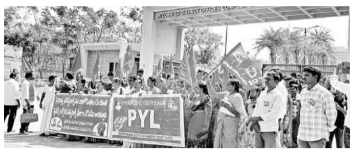
భద్రాద్రి కొత్తగూడెం జిల్లా కలెక్టరేట్లోని డీఎంపావం కార్యాలయం ఎదుట దర్నా చేస్తున్న పీవీఎల్, పీవోడబ్ల్యూ నాయకులు

అయిజ, జనవరి 31: జోగుకొండ గద్వాల జిల్లా అయిజ మండలం బింగి దొడ్డి చెరువులో నీటి నిల్వలు పెంచేందుకు రైతులు ముందుకొచ్చారు. తాటి కుంట రిజర్వాయర్ నుంచి బింగిదొడ్డి చెరువుకు నీటిపారుదల తూము ఉన్నా కాల్పు పూర్తికావడంతో నీటి చేరిక ఆలస్యమవుతున్నది. ఈ విషయాన్ని ఇరిగేషన్ అధికారుల దృష్టికి తీసుకొచ్చిన సహకార సంఘంలో కలిసి 15 మంది కర్షకులు స్వచ్ఛందంగా కదిలారు. నెట్టం పాడు ప్రాజెక్టు పరిధిలోని తాటికుంట రిజర్వాయర్ నుంచి బింగిదొడ్డి చెరువు వరకు నీటిని పారించేందుకు 3 కిలోమీటర్ల డీ-1 కాల్వలో పూడికతీత తొలగించు పనులు శుక్రవారం చేపట్టారు. ఈ పనులు శుక్రవారం చేపట్టారు. ముఖ్యంగా తొలగించు పనులు రూ.3 లక్షల వరకు ఖర్చు కావచ్చని, సాంతంగా డబ్బులు వేసుకొని పనులు చేపడుతున్నట్లు రైతులు తెలిపారు.