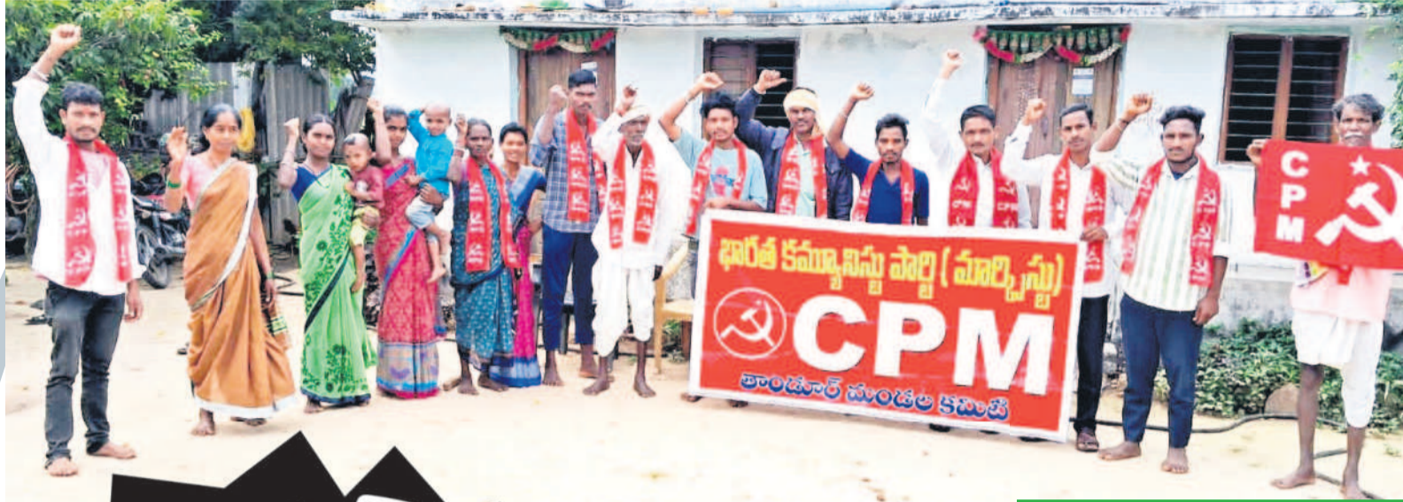
తాండూర్ : సర్కారులో నిరసన తెలుపుతున్న సీపీఎం నాయకులు