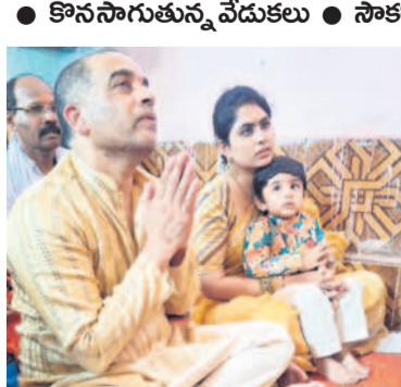
తన కుమారుడికి లక్షరూపాయలను చెయ్యమన్న బోధా

కొనసాగుతున్న వేడుకలు • సౌకర్యాలు కల్పించడంలో విఫలమైన ప్రభుత్వం