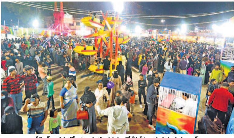
వీకెండ్ కావడంతో అదివారం సందర్భాలలో కిటకిటలాడుతున్న సుమాయిష్