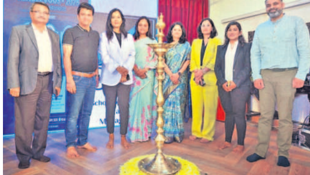
రాంధేవో-2025 విత్ హెచ్ఆర్ సదస్సు