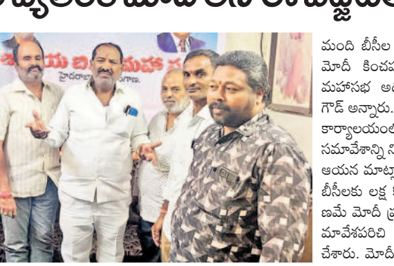
మాట్లాడుతున్న జాతీయ బీసీ మహాసభ అధ్యక్షుడు రాజేంద్రవల్లభ్ గౌడ్

కాచిగూడ, ఫిబ్రవరి 2: కేంద్ర ప్రభుత్వం పార్లమెంట్ లో ప్రవేశపెట్టిన రూ. 50.85 లక్షల కోట్ల బడ్జెట్ లో బీసీలకు సౌకర్యం కల్పించే తీరుపై 75 కోట్ల