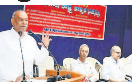
సదస్సులో మాట్లాడుతున్న విశ్రాంత జస్టిస్ చంద్రకుమార్

విక్రమపట్టి, ఫిబ్రవరి 2: రాష్ట్ర ప్రభుత్వం అన్ని కేంద్ర ప్రభుత్వ వివక్ష పెరిగిపోయిందని విశ్రాంత జస్టిస్ చంద్రకుమార్ అన్నారు. బజ్జెట్ లో రాష్ట్రానికి తీవ్ర వివక్ష చూపారని తెలి