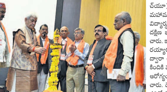
జ్యోతి వెలిగించిన సమావేశాన్ని ప్రారంభిస్తున్న మనోజ్ సిన్హా

ఉస్మానియా యూనివర్సిటీ, ఫిబ్రవరి 2: గ్రామాభివృద్ధి ద్వారానే వికసిత భారత్ సాధ్యమవుతుందని జమ్మలగూడెం కేంద్ర రైస్ సెంటర్ గవర్నర్ మనోజ్ సిన్హా అన్నారు. దేశం పురోగాభివృద్ధి సాధించాలంటే విద్య అంతా అవకాశాల కల్పన కోసం కేంద్ర ప్రభుత్వం ఎలాంటి నిధులు కేటాయించలేదని మండిపడ్డారు. దేశంలోని ఆధి