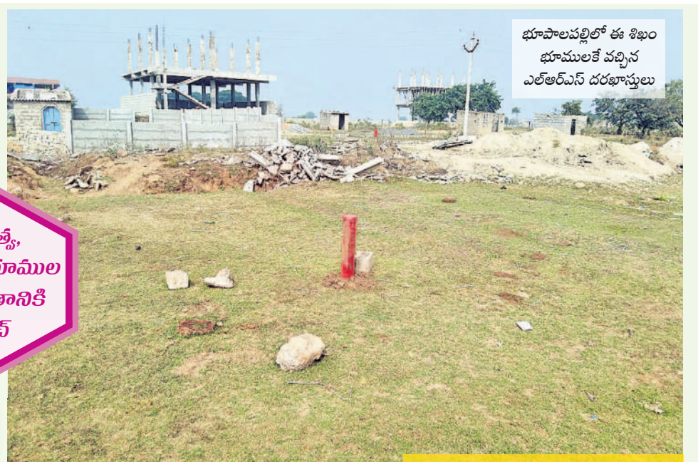
భూపాలపల్లిలో ఈ శిఖం భూములలో వచ్చిన ఎల్ఆర్ఎస్ దరఖాస్తులు

జిల్లాలో 8312 దరఖాస్తులు జిల్లాలో మొత్తం 8312 మంది ఎల్ఆర్ఎస్ ఎన్ కోసం దరఖాస్తు చేసుకున్నారు. భూపాలపల్లి మున్సిపాలిటీలో 3771, భూపాలపల్లి మండలంలో 191, చిట్టూరులో 28, గణపరంబోలో 1573, కాటూరులో 2196, మహాదేవపూర్లో 832, మల్లంపల్లిలో 115, మహామూలూరులో 15, బీకుపట్టణంలో 14, రేగోండ మండలంలో 75 దరఖాస్తులు వచ్చాయి. కాగా జిల్లాలోని 10 మండలాల నుంచి వచ్చిన దరఖాస్తులు ఇంకా పరిశీలన దశలోనే ఉండగా, కేవలం భూపాలపల్లి మున్సిపాలిటీ పరిధిలో మాత్రమే 1214 దరఖాస్తులు అప్లౌన్ అయ్యాయి. ఎల్ఆర్ఎస్ దరఖాస్తులను పరిశీలించేందుకు మండలానికి ఒక టీంను ఏర్పాటు చేశారు. ఇందులో ఆయా డివిజన్ మెంట్ల నుంచి నలుగురు సభ్యులు ఉంటారు. లెవల్ 1, లెవల్ 2 వెరిఫికేషన్ తర్వాత ఫైనల్ చేస్తారు. 3925 దరఖాస్తులు లెవల్ 1 దశలో, 1712 లెవల్ 2 దశలో ఉన్నాయి. దరఖాస్తుదారులు డాక్యుమెంట్ వ్యాల్వూస్ 14 శాతం చెల్లించాల్సి ఉంటుంది. ఇల్లీగల్ ఫ్లాటింగ్ చేసిన వెంచర్ యజమానులు గ్రీన్ ల్యాండ్ చార్జీస్ 14 శాతం, డెవలప్ మెంట్ చార్జీలు గణానికి రూ.100 చెల్లించాలి. 60 ఇల్లీగల్ వెంచర్ వ్యాపారులు ఎల్ఆర్ఎస్ కు దరఖాస్తు చేసుకున్నారు.