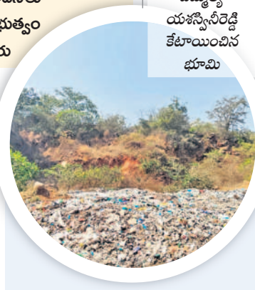
మడిపెల్లిలో ఎమ్మెల్యే యశస్వినీరెడ్డి కేటాయించిన భూమి

తొర్రూరు ఫిబ్రవరి 2: గత టీఆర్ఎస్ ప్రభుత్వం తొర్రూరు పట్టణానికి మంజూరు చేసిన వంద పడకల ప్రభుత్వ దవాఖాన నిర్మాణంపై వివాదం నెలకొన్నది. తొర్రూరులో నిర్మించాలని సాగునీరు కోరుతుండగా, సాగునీరు పాలకుర్తి ఎమ్మెల్యే మామిడాల యశస్వినీరెడ్డి మాత్రం మడిపెల్లి గ్రామ సమీపంలో సర్వేనంబర్ 521 నువ్వారు 5 ఎకరాల భూమిలో నిర్మించేందుకు ప్రతిపాదనలు చేయడంతో ప్రజలు తీవ్ర అసంతృప్తిని వ్యక్తం చేస్తున్నారు. పట్టణానికి అనుబంధంగా ప్రభుత్వ దవాఖానను ఏర్పాటు చేస్తే ప్రజలకు అందుబాటులో ఉంటుందని, అత్యవసర సేవలు త్వరగా అందుతాయని సాగునీరు అభిప్రాయం వ్యక్తం చేస్తున్నారు. పట్టణానికి అనుబంధంగా ప్రభుత్వ దవాఖానను ఏర్పాటు చేస్తే ప్రజలకు అందుబాటులో ఉంటుందని, అత్యవసర సేవలు త్వరగా అందుతాయని సాగునీరు అభిప్రాయం వ్యక్తం చేస్తున్నారు. పట్టణానికి అనుబంధంగా ప్రభుత్వ దవాఖానను ఏర్పాటు చేస్తే ప్రజలకు అందుబాటులో ఉంటుందని, అత్యవసర సేవలు త్వరగా అందుతాయని సాగునీరు అభిప్రాయం వ్యక్తం చేస్తున్నారు. పట్టణానికి అనుబంధంగా ప్రభుత్వ దవాఖానను ఏర్పాటు చేస్తే ప్రజలకు అందుబాటులో ఉంటుందని, అత్యవసర సేవలు త్వరగా అందుతాయని సాగునీరు అభిప్రాయం వ్యక్తం చేస్తున్నారు.