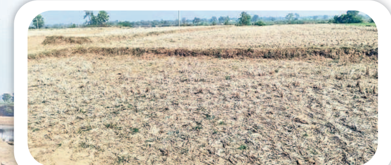
సర్పంచలపేట: ముంగిమడుగు శివారంలో తెగిపోయిన చెక్ డ్యాం, (ఇన్సెట్) నీరు లేక బీడుగా మారిన పంట పొలాలు

ముగ్గురు నిందితుల వద్ద మొత్తం సాత్తు దొంగల మూడు అర్థ ప్రదేశ్ కు చెందిన ముగ్గురు దొంగలతోపాటు కారు డ్రైవర్ ను పోలీసులు అరెస్ట్ చేశారు. ఇంకా ముగ్గురిని అరెస్ట్ చేయాల్సి ఉంది. వీరిలో ముంబైకి చెందిన ఇద్దరు, ఉత్తరప్రదేశ్ కు చెందిన మరో దొంగ ఉన్నారు. వీరి వద్దనే లికవరీ కావాల్సిన మొత్తం బంగారం ఉందని చెబుతున్నారు. డోపిడీ జరిగిన రెండు నెలలు దాటిగా ముగ్గురు దొంగలను పోలీసులు పట్టుకోలేకపోతున్నారు.