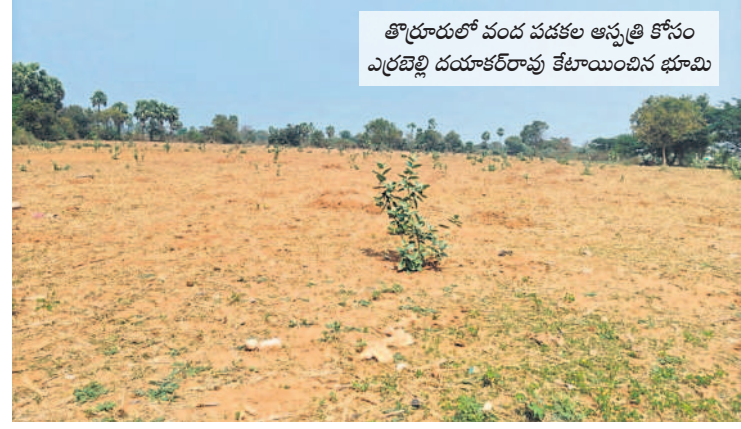
తొర్రూరులో వంద పడకల ఆస్పత్రి కోసం ఎర్రబెల్లి దయాకరరావు కేటాయించిన భూమి