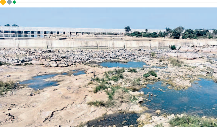
సర్పంచలపేట: ముంగిమడుగు శివారంలో తెగిపోయిన చెక్ డ్యాం, (ఇన్సెట్) నీరు లేక బీడుగా మారిన పంట పొలాలు