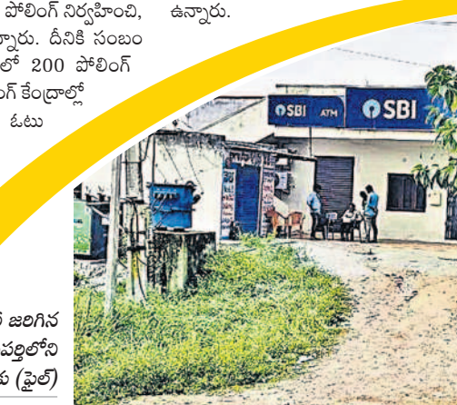
పోలీస్ జరిగిన రాయపల్లిలోని బ్యాంకు (ఫైల్)