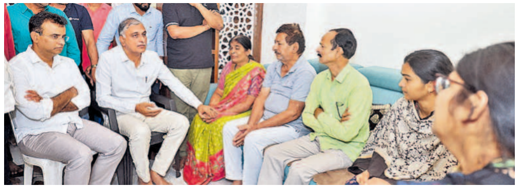
అయల్ ఎస్సీల సర్వేలో అత్యంత వేగవంతం చేసుకున్న బిల్లర్ వెణుగోపాల్రెడ్డి నివాసానికి ఆదివారం బీఆర్ఎస్ నాయకులతో కలిసి వెళ్లి, కుటుంబసభ్యులను పరామర్శిస్తున్న మాజీ మంత్రి హరిశ్చంద్రా, ఎమ్మెల్యే వినోకానంద తదితరులు