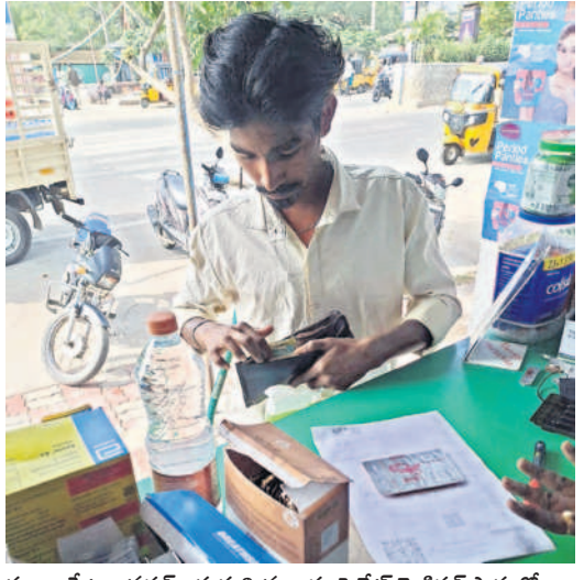
సూర్యాపేట జనరల్ ఆసుపత్రు ముందు ప్రైవేట్ మెడికల్ షాపులో మందులు కొనుగోలు చేస్తున్న ఓ రోగి బంధువు

కాంగ్రెస్ ప్రభుత్వం అధికారంలోకి వచ్చిన తర్వాత రోగులకు ఉచిత వైద్యం అందడం అవ్వటం వదులుతున్నారు. మెరుగైన వైద్యం కోసం ప్రైవేట్ దవాఖానలను ఆక్రమిస్తూ ఆర్థికంగా ఇబ్బందులు పాలవుతున్నారు. సూర్యాపేట జిల్లా కేంద్రంలోని జనరల్ దవాఖానలో పాపం అను పుత్రుల్లో వైద్య సేవలు దాదాపు పడిపోయాయి. బీఆర్ఎస్ అధికారంలో ఉన్న దినం ఏడాది 2023లో జిల్లాలో 5,167 ప్రసవాలు కాగా, 2024లో 4,243 మాత్రమే జరిగాయంటే ప్రజలు ప్రభుత్వ దవాఖానలపై ఏ రీతిన నమ్మకం కోల్పోయారో అర్థమవుతుంది. ప్రభుత్వ దవాఖానల్లో డాక్టర్లు, సిబ్బంది అందుబాటులో ఉండకపోవడం, సరిపడా మందులు లేకపోవడం, జనరల్ ఆసుపత్రులో అత్యధికంగా షైన్ల ఇయర్ ఎంటిబీఎం విద్యార్థులే చికిత్సలు అందిస్తుండడం కారణంగా తెలుస్తున్నది.