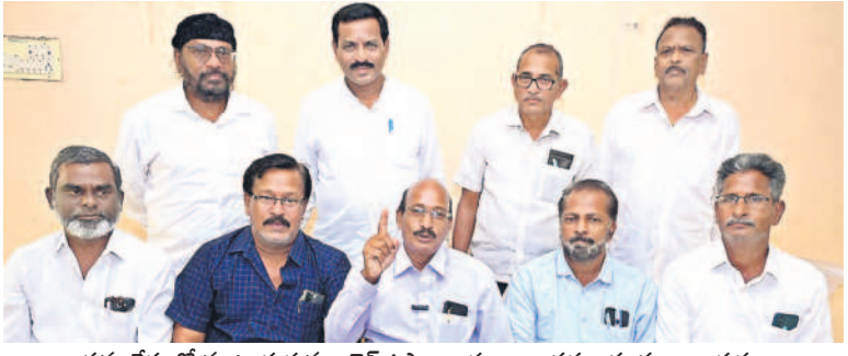
సమావేశంలో మాట్లాడుతున్న రిటైర్డ్ ఉపాధ్యాయ, అధ్యాపకల సంఘం నాయకులు