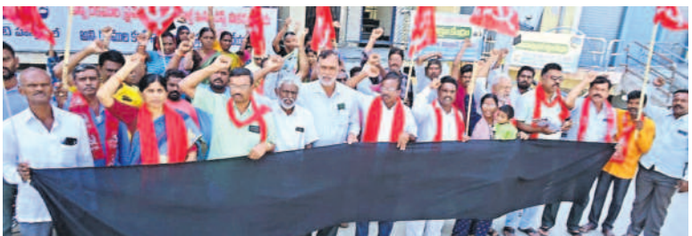
నల్లగొండలో సల్ల జిండాతో నిరసన తెలుపుతున్న సీపీఎం నాయకులు