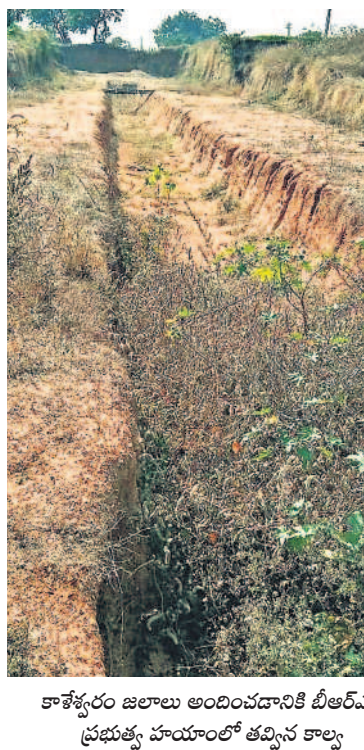
కాళేశ్వరం జలాలు అందించడానికి బీఆర్ఎస్ ప్రభుత్వ హయాంలో తవ్విన కాల్వ