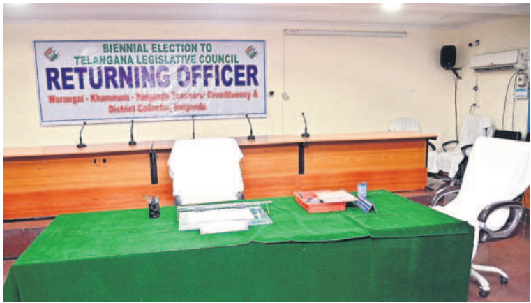
నల్లగొండ కలెక్టరేట్లోని లిటల్ గింగ్ కార్యాలయంలో నామినేషన్ స్వీకరణకు చేసిన ఏర్పాట్లు