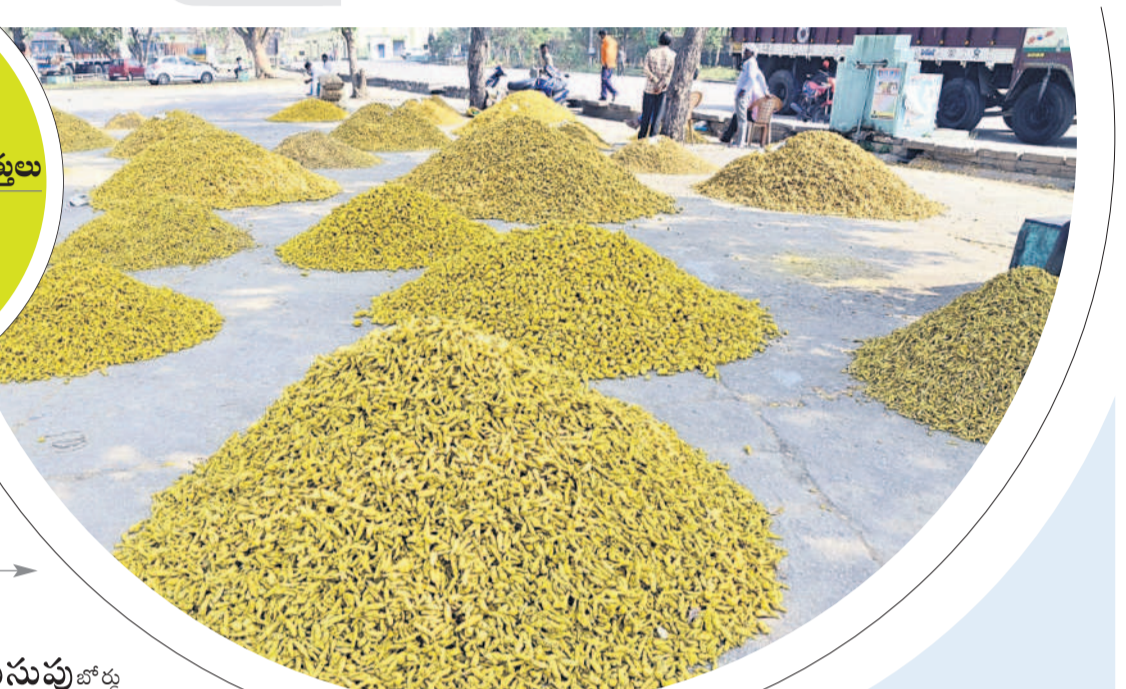
నిజామాబాద్ మార్కెట్ యార్డుకు వచ్చిన పసుపు

ఎకరాకు 15-20 క్వింటాళ్ల దిగుబడి.. ఆందోళనలో జిల్లా రైతాంగం మార్కెట్ కు వస్తున్న పసుపు ఉత్పత్తులు అంతంత మాత్రంగానే ధరలు పట్టించుకోని కేంద్ర, రాష్ట్ర ప్రభుత్వాలు