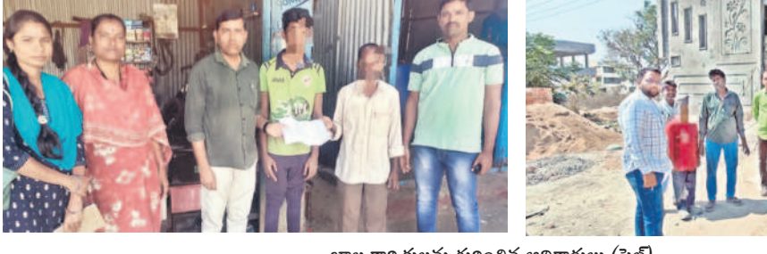
బాల కార్మికులను గుర్తించిన అధికారులు (ఫ్రైల్)