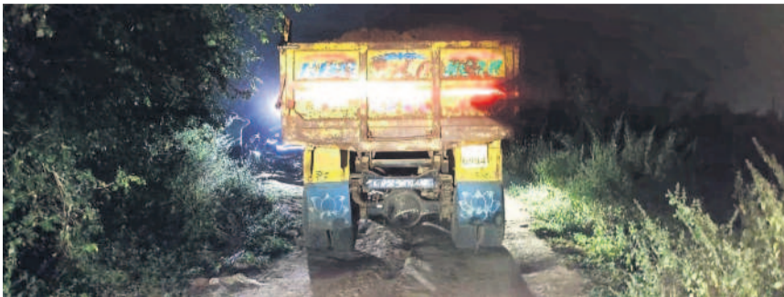
ధాత్రికాన్ పేషెంట్ శివారులో అర్ధరాత్రి వేళ టిప్పర్ లో తరలిస్తున్న మొరం