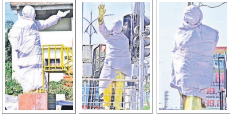
ఎన్టీఆర్, రాజ్ గంగోత్రి, ఇందిరాగంగోత్రి విగ్రహాలకు ముసుగువేసిన అధికారులు

నిజామాబాద్, ఫిబ్రవరి 4 (నమస్తే తెలంగాణ ప్రతినిధి) జిల్లా అధికారులు ఎట్టకేలకు నిద్ర లేచారు. విగ్రహాలకు ముసుగులు వేశారు. ఎన్నికల కోడ్ ఉల్లంఘనలోకి వచ్చినా వివిధ నాయకుల విగ్రహాలకు ముసుగులు వేయకపోవడాన్ని ఎత్తి చూపుతూ 'కోడ్ కూసినా నిద్ర లేవని యంత్రాంగం' శీర్షికన నమస్తే తెలంగాణ యంపరిచిన కథనంతో అధికారులు నిద్ర మత్తు వీడారు. వివిధ కూడళ్లలో ఉన్న గులు వేయకుండా మంగళవారం ముసుగులు వేయాలని ఆదేశాలు జారీ చేశారు. రాష్ట్రంలో దాదాపుగా సగాని కన్నా ఎక్కువ ప్రాంతాల్లో ఎన్నికల కోడ్ అమలులోకి వచ్చింది. ఉమ్మడి కరీంనగర్, మెదక్, ఆదిలాబాద్, నిజామాబాద్ పట్టణ ప్రభుత్వం, ఉపాధ్యాయ నియోజకవర్గాలకు, ఉమ్మడి వరంగల్, నల్గొండ, ఖమ్మం టీచర్ ఎమ్మెల్యే స్థానానికి కేంద్ర ఎన్నికల సంఘం