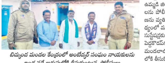
బిమ్మింద మండల కేంద్రంలో అంబేద్కర్ సంఘం నాయకులను ఇండ్ల వద్దే అదుపులోకి తీసుకుంటున్న పోలీసులు

నమస్తే తెలంగాణ యంత్రాంగం, ఫిబ్రవరి 4: ఉమ్మడి జిల్లాలోని మాల మహానాడు నాయకులను పోలీసులు నిర్బంధించారు. ఎన్నో వర్గీకరణను వ్యతిరేకిస్తూ చేపట్టిన అసెంబ్లీ ముట్టడి నేపథ్యంలో మంగళవారం ముందస్తు అరెస్టు చేసి పోలీసుస్టేషన్లకు తరలించారు. ఉమ్మడి జిల్లాలోని బోధన్, పెద్దకోడవగల్, బిమ్మింద, గుద్దూర్, మోస్తా తదితర మండలాల్లో మాల మహానాడు నాయకులను అదుపులోకి తీసుకొని పోలీసుస్టేషన్లకు తరలించారు.