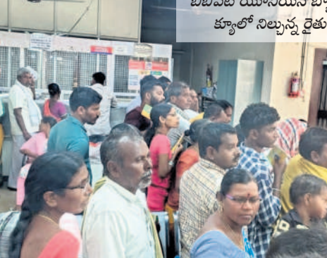
బిబీపేట యూనియన్ బ్యాంకులో క్యూలో నిల్చున్న రైతులు