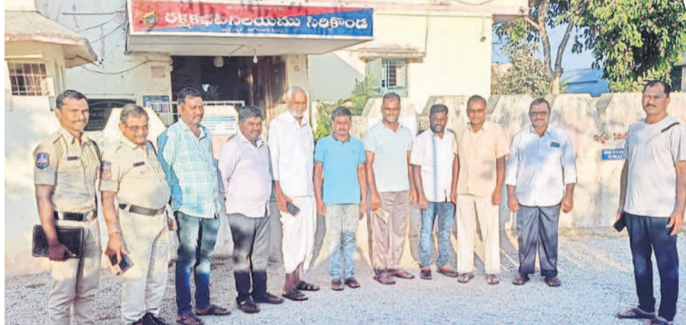
సిరికొండ పోలీసు స్టేషన్లో మాజీ సర్పంచులు

మోర్లాడ్/ధర్మలి/సిరికొండ/ఆర్కాట్ టౌన్/బీ మగల్/బోధన్ రూరల్, ఫిబ్రవరి 4: సర్పంచులకు అందాల్సిన పెండింగ్ బిల్లులు చెల్లించాలని డిమాండ్ చేస్తూ తాజా మాజీ సర్పంచులు చేపట్టిన 'అసెంబ్లీ ముట్టడి'ని ఉమ్మడి జిల్లాలో పోలీసులు అడ్డుకొన్నారు. ముందస్తు అరెస్టులు చేశారు. మోర్లాడ్, ధర్మలి, సిరికొండ, ఆర్కాట్, బోధన్ తదితర మండలాల్లో తాజా మాజీ సర్పంచులను మంగళవారం ఉదయం అదుపులోకి తీసుకొని పోలీసుస్టేషన్లకు తరలించారు. క్షుణ్ణ గట్టిస రెవంట్ సర్కార్ తమకు రావాల్సిన పెండింగ్ బిల్లులను అడగడానికి వెళ్లి అరెస్టు చేయడం శోచనీయమని తాజా మాజీ సర్పంచులు అన్నారు. ఏదాదాగా బిల్లులు ఉసానీలేదన్నారు. గ్రామాన్ని అభివృద్ధి చేసే జాబయ స్కాయల్ ఉత్తమ గ్రామ పంచాయతీ అవార్డులు పొందిన సర్పంచులకు బిల్లులు ఇవ్వకుండా కక్షగట్టి ఇండ్లకు వచ్చి అరెస్టు చేయడం దుర్మార్గమన్నారు. సర్పంచులకు బిల్లులు ఇవ్వకుండా వారిని మరొక ఊరిలో నెట్టడం సహకారం చేశారు. పెండింగ్ బిల్లులు ఇవ్వాలని, లేదంటే పాలన చేతకాదని ఒప్పుకోవాలన్నారు. ప్రస్తుత సీఎం రెవంట్ రెడ్డి ప్రతిపక్షంలో ఉన్నప్పుడు