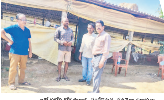
అక్కోర్లోని కోళ్ల ఫారాన్ని పరిశీలిస్తున్న పశువైద్యాధికారులు