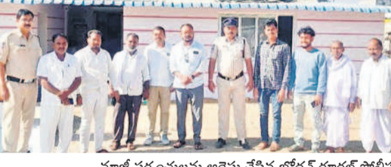
మాజీ సర్పంచులను అరెస్టు చేసిన బోధన్ రూరల్ పోలీసులు

సర్పంచులకు పెండింగ్ బిల్లులు ఇచ్చి వారిని గౌరవంగా చూడాలని సుద్దపూస మాటలు మాట్లాడి ఇందిరాపార్కు వద్ద ధర్మా చేశారని గుర్తుచేశారు. ఇప్పుడు అధికారంలోకి వచ్చాక సర్పంచులపై కక్షగట్టి ఏదాదాగా బిల్లులు ఇవ్వకుండా ఇబ్బందులు పెడుతున్నారని మండిపడ్డారు.