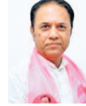
50 వేల టీఎంసీలు సముద్రం పాలవుతున్నాయని, మిగిలిన 20 వేల టీఎంసీలు మాత్రమే ఆయన వివరించారు. నదీజలాల పంపిణీ, వివాదాలను పరిష్కరించటంలో ట్రిబ్యునల్ల సహకారం స్పందించటం లేదని మండిపడ్డారు. నీటి పంపిణీ విషయంలో రాష్ట్రాల మధ్య యుద్ధ వాతావరణం నెలకొన్నదని పేర్కొన్నారు. కృష్ణా, గోదావరి ట్రిబ్యునల్ల తెలంగాణ, ఏపీ మధ్య ఉన్న వివాదాలను పరిష్కరించుకోగ

వ్యక్తం చేశారు. రాష్ట్రపతి ప్రసంగానికి ధన్యవాదాలు తెలిపి తీర్మానంపై జరిగిన చర్చలో ఆయన ప్రసంగానికి చాలా దేశంలో సహజ వనరుల వినియోగం ప్రత్యేకంగా నడి జలాలు, విద్యుత్ వినియోగం విషయంలో దశాబ్దాలుగా రాష్ట్రాల మధ్య, రాష్ట్రాల్లోని ప్రాంతాల మధ్య తీవ్ర వ్యత్యాసాలున్నాయని స్పష్టం చేశారు. దేశవ్యాప్తంగా 1.40 లక్షల టీఎంసీల వద్దం కురిస్తే అందులో సగం ఆవిరిపోతుందని, మిగిలినదాంట్లో