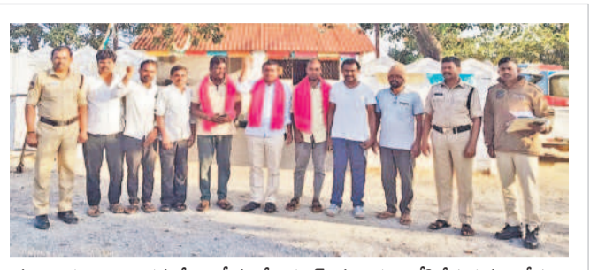
నల్లగొండ జిల్లా కొండమల్లెపల్లిలో మాజీ సర్పంచ్ లను అడుపులోకి తీసుకున్న పోలీసులు

సాధ్యమైనంత తొందరగా స్థానాల ఎన్నికలు నిర్వహించాలని ప్రభుత్వం భావిస్తున్నది. ఈ పరిస్థితుల్లో మండల పరిషత్, జిల్లా పరిషత్ వ్యవస్థల నిర్వహించాలని సంకల్పిస్తున్నది. ఈ నెల 15 తర్వాత షెడ్యూల్ విడుదల చేసి రెండు వారాల్లో ఎన్నికల ప్రక్రియను పూర్తిచేయాలని సూత్రప్రాయ నిర్ణయానికి వచ్చినట్లు ప్రభుత్వం ప్రకటించింది. ఇప్పటికే రాష్ట్ర ఎన్నికల సంఘానికి సమాచారం అందింది. సట్టు సమాచారం, ఎంపీటీసీ స్థానాల పునర్వ్యవస్థీకరణను కూడా పూర్తిచేయాలని నిర్దేశించినట్లు తెలిసింది. ఫలితాల ఆధారంగానే పంచాయతీ.. ఎంపీటీసీ, జడ్పీటీసీ ఎన్నికల్లో అధికార పార్టీకి అనుకూల ఫలితాలు వస్తే ఆ వెంటనే సర్వే ఎన్నికలు నిర్వహించాలని ప్రభుత్వం భావిస్తున్నది. ప్రతికూల ఫలితాలు వస్తే మూత్రం వెనుకకుగా వేసి అవకాశం ఉంటుందని రాజకీయ విశ్లేషకులు భావిస్తున్నారు.