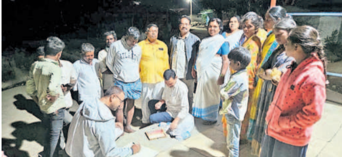
రుద్రారం గ్రామంలో రక్త సమూహాను సేకరిస్తున్న ఫైలేరియా నిబ్బంది