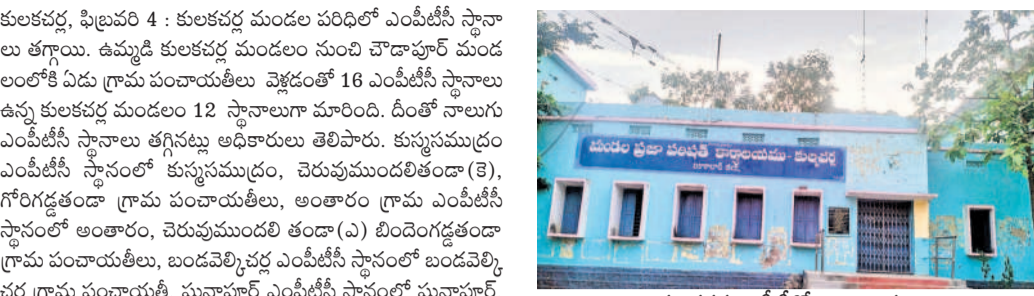
కులకచర్ల ఎంపీటీసీ కార్యాలయం

కులకచర్ల, ఫిబ్రవరి 4: కులకచర్ల మండల పరిధిలో ఎంపీటీసీ స్థానాలు తగ్గాయి. ఉమ్మడి కులకచర్ల మండలం నుంచి చౌదాపూర్ మండలంలోకి ఏడు గ్రామ పంచాయతీలు వెళ్లడంతో 16 ఎంపీటీసీ స్థానాలు ఉన్న కులకచర్ల మండలం 12 స్థానాలుగా మారింది. దీంతో నాలుగు ఎంపీటీసీ స్థానాలు తగ్గినట్లు అధికారులు తెలిపారు. కున్నసముద్రం ఎంపీటీసీ స్థానంలో కున్నసముద్రం, చెరువుముందులితండా (పి), గోరిగడ్డతండా గ్రామ పంచాయతీలు, అంతారం గ్రామ ఎంపీటీసీ స్థానంలో అంతారం, చెరువుముందులి తండా (ఎ) లింగంగడ్డతండా గ్రామ పంచాయతీలు, బండవెల్లిచర్ల ఎంపీటీసీ స్థానంలో బండవెల్లిచర్ల గ్రామ పంచాయతీ, భూనాపూర్ ఎంపీటీసీ స్థానంలో భూనాపూర్, బొండ్లపల్లి గ్రామ పంచాయతీలు, ఇప్పాయిపల్లి ఎంపీటీసీ స్థానంలో ఇప్పాయిపల్లి, రాంపూర్ గ్రామ పంచాయతీలు, కులకచర్ల-1 ఎంపీటీసీ స్థానానికి కులకచర్ల గ్రామ పంచాయతీ, కామనపల్లి ఎంపీటీసీ స్థానానికి కామనపల్లి, చాపలగూడెం, ఎత్తుకాలతండా, పీరంపల్లి గ్రామ పంచాయతీలు, ముజాహిద్పూర్ ఎంపీటీసీ స్థానానికి ముజాహిద్పూర్, రాండ్లపల్లి గ్రామ పంచాయతీలు, పటిలేచెరువు తండా ఎంపీటీసీ స్థానానికి దాస్యనాయకతండా, పటిలేచెరువుతండా, బోట్లనాయకతండా, అల్లూర్ గ్రామ పంచాయతీలు, పుట్టపహాడి ఎంపీటీసీ స్థానానికి పుట్టపహాడి, అనంతసాగర్ గ్రామ పంచాయతీలను కేటాయించారు. కాగా కులకచర్ల మండల పరిధిలోని పీరంపల్లి గ్రామ పంచాయతీ గతంలో లింగంపల్లి ఎంపీటీసీ స్థానానికి ఉండేది. లింగంపల్లి చౌదాపూర్ మండలానికి వెళ్లడంతో పీరంపల్లి గ్రామ పంచాయతీని కామనపల్లి ఎంపీటీసీ స్థానంలో విలీనం చేశారు. దీంతో ఈ ఎంపీటీసీ స్థానానికి పోటీ చేయాలంటే నాలుగు గ్రామ పంచాయతీల ఓటర్లకు అవసరం ఉంటుంది.