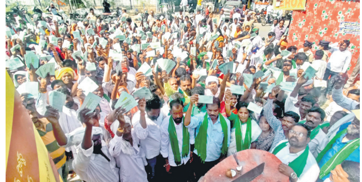
పోస్టు కార్యాలను పంపిస్తున్న కాలనీవాసులు