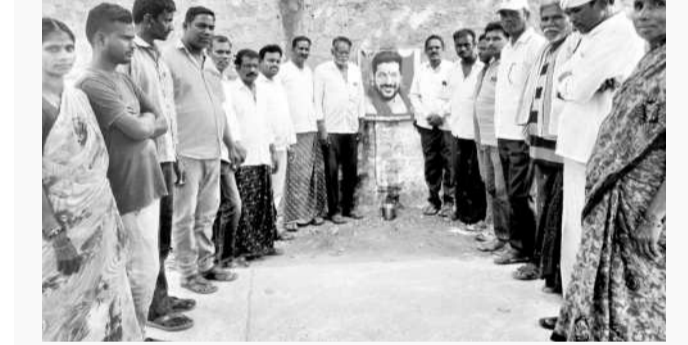
మల్లెంపాడుగులో అందరికీ పైకీకి మదకపెట్టి రేపంకెర్ల పైకీకి క్షీరాభిషేకం చేస్తున్న కాంగ్రెస్ నాయకులు