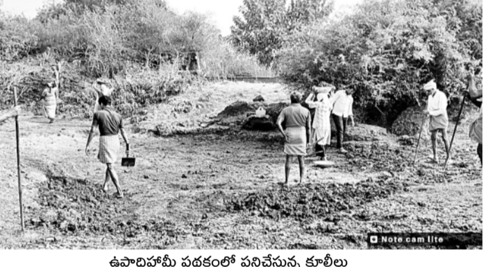
ఉపాధిపాపీ పథకంలో పనిచేస్తున్న కూలీలు

ఉండాలనే నిబంధనలతోపాటు ఆయా కూలీలకు కుంట వ్యవసాయ భూమి కూడా ఉండకూడదు. అలాగే రైతు భరోసా పథకం అర్హులైన రుద్దా ఉంటే.. అతడిని ఇందిరమ్మ ఆత్మీయ భరోసా పథకానికి అనర్హులుగా తేల్చారు. దీంతో