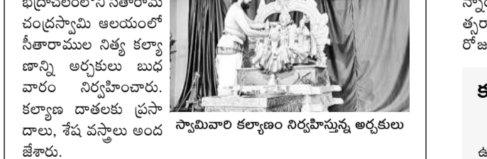
సామివారి కల్పాణం నిర్వహిస్తున్న అధ్యక్షులు