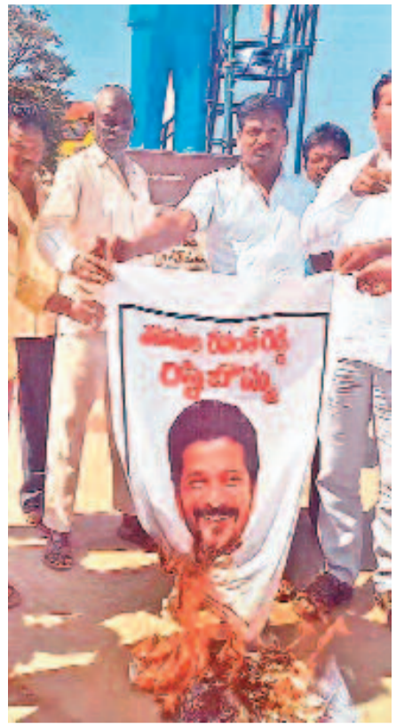
పలుచోట్ల సీఎం, ప్రభుత్వ బిళ్లబోమ్మల దహనం.. లన్ని వర్గాల ఆగ్రహంతో రాష్ట్రంలో వేదెక్కిన వాతావరణం

గురువారం THURSDAY 6.2.2025 కరీంనగర్ KARIMNAGAR పేజీలు: 14 Pages: 14 నవమి గురువారం, సూర్యోదయం: 6-46, సూర్యాస్తమయం: 6-14. శ్రీ క్రోధి నామ సంవత్సరం ఉత్తరాయణం శిశిర రుతువు మాఘ మాసం శుక్ల పక్షం తిథి: నవమి రాత్రి 10-58 వరకు, నక్షత్రం: కృత్తిక రాత్రి 9-29 వరకు, వర్షం: ఉదయం 8-01 నుంచి ఉదయం 9-82 వరకు, రాహుకాలం: పగలు 1-55 నుంచి పగలు 3-21 వరకు, దుర్భుధార్యం: ఉదయం 10-85 నుంచి ఉదయం 11-21 వరకు, పునర్ దుర్భుధార్యం: పగలు 3-10 నుంచి పగలు 3-55 వరకు, అమృతకాలం: సాయంత్రం 6-11 నుంచి సాయంత్రం 6-48 వరకు, ధన్వంతరీ ఉదయం 7-48 గంటలకు.