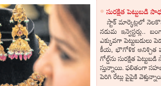
హైదరాబాద్ లో తులం 87,000

పెండింగ్ సీజన్ కావడంతో రాబోయే రోజుల్లో ఇంకా పెరగవచ్చన్న సంతకాలున్నాయి.