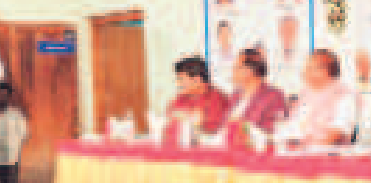
మాట్లాడుతున్న మాజీ సీనియర్ సర్పంచులు