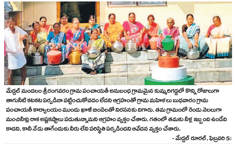
మేడల్ మండలం శ్రీరంగవరం గ్రామ పంచాయతీ అనుబంధ గ్రామమైన కుమ్మరిగడ్డలో కొన్ని రోజులుగా తాగునీటి కటకట దుర్బిణి పట్టించుకోవడం లేదని ఆగ్రహంతో గ్రామ మహిళలు బుధవారం గ్రామ పంచాయతీ కార్యాలయం ముందు ఖాళీ బెండ్లతో నిరసనకు దిగారు. తమ గ్రామంలో రెండు నెలలుగా మంచినీళ్లు లాక అప్లై పడుతున్నామని ఆగ్రహం వ్యక్తం చేశారు. గతంలో తమకు నీళ్లు ఇబ్బంది ఉండేది కాదని, కానీ నేడు తాగించుకుని రేణు పరిస్థితి ఏర్పడిందని ఆవేదన వ్యక్తం చేశారు.