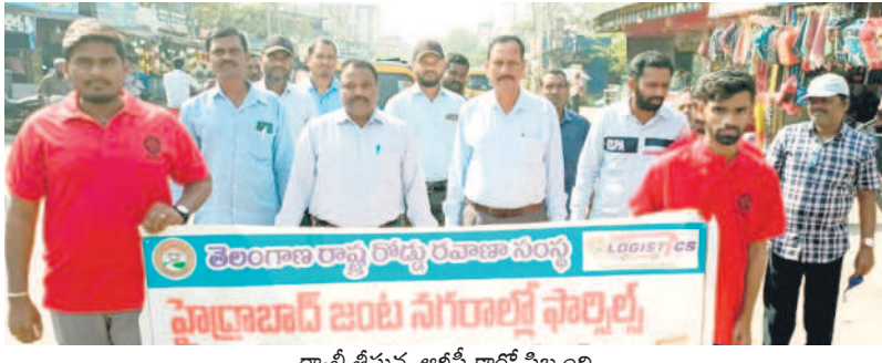
ర్యాలీ తీస్తున్న ఆర్టీసీ కార్డ్ సిబ్బంది

జగిత్యాల, ఫిబ్రవరి 5: జగిత్యాల బస్టాండ్ నుంచి మార్కెట్ రోడ్డు వరకు ఆర్టీసీ లాజిస్టిక్స్ కార్గో సేవలపై సిబ్బంది ఆధ్వర్యంలో ర్యాలీ తీశారు. కార్లో సేవలపై ప్రజలకు అవగాహన కల్పించారు. ఆర్టీసీ సిబ్బంది మాట్లాడుతూ, కార్తో సేవలను ప్రజలు వినియోగిం