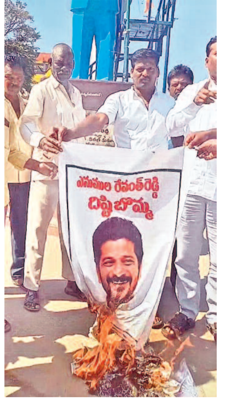
పలుచోట్ల సీఎం, ప్రభుత్వ బిళ్లబొమ్మల దహనం.. లన్ని వర్గాల ఆగ్రహంతో రాష్ట్రంలో వేదకీన వాతావరణం