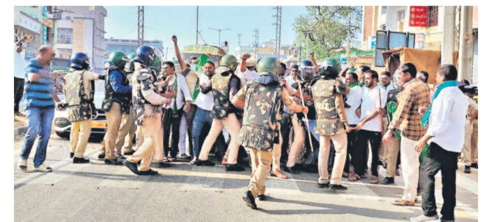
ప్యారానగర్ అటవీ ప్రాంతంలో డంపింగ్ యార్డు వద్దని అందోళన చేస్తున్నవారిని అడ్డుకుంటున్న పోలీసు బలగాలు

గతంతో పోలిస్తే తగ్గిన లక్ష మంది రైతులు విస్తీర్ణం 5.92 లక్షల ఎకరాలు పెరుగుదల ఇదెలా అంటున్న నిపుణులు పెట్టుబడి సాయం లెక్కలపై అనుమానాలు హైదరాబాద్, ఫిబ్రవరి 5 (సమస్తి తెలంగాణ): రైతు భరోసా పంపిణీలో ప్రభుత్వం చెప్పున్న లెక్కలు గందరగోళంగా ఉన్నాయి. ఎకరం భూమిని పరిమితిగా తీసుకున్న పుట్టుక సంఖ్య తగ్గితే ఆ మేరకు భూమి విస్తీర్ణంలో మార్పు ఉండకూడదు. రైతుల సంఖ్య పెరిగితే భూమి విస్తీర్ణం కూడా పెరగాలి. కానీ ప్రభుత్వం చెప్పున్న లెక్కల్లో రైతుల సంఖ్య తగ్గితే.. భూమి విస్తీర్ణం పెరిగింది. మరి పెరిగిన భూమి ఎవరి పేరున ఉంది.. ఏ విధంగా పెరిగిందనేది అంతచిక్కని ప్రశ్న. ఇక 2023 వానకాలం లెక్కలతో పోలిస్తే ఈ యాసంగి రైతుభరోసా లెక్కల్లో భారీ తేడాలున్నాయి. ప్రభుత్వం బుడవారం ఎకరం వరకు లక్ష రైతుభరోసా వారి ఖాతాల్లో జమ చేసినట్లు ప్రకటన విడుదల చేసింది. గత నెల 27న జరిగిన పంపిణీతో కలిపి ఎకరం వరకు ఉన్న రైతులు 21,45,330 మందికి రూ.1126.54 కోట్లు > 11వ పేజీలో