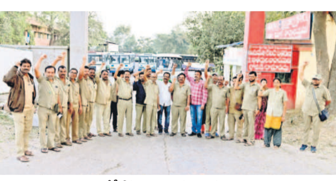
మంచిర్యాల ఆర్టీసీ డిపో ఎదుట నిరసన తెలుపుతున్న కార్మికులు

పార్టీ పరంగా వాటాతో ఒరిగేదే లేదు మొన్నటి పరకా రాజ్యాంగబద్ధంగా రిజర్వేషన్లు కల్పిస్తామని చెప్పి.. ఇప్పుడు పార్టీ పరంగా వాటాను సీద్దమని కాంగ్రెస్ పార్టీ చెప్పింది. కానీ.. దానితో ఒరిగేదే లేదని బీసీ సంఘాలు అంటున్నాయి. బీసీలకు 42 శాతం రిజర్వేషన్లు చట్టబద్ధత కల్పించకుండా పార్టీ పరంగా వాటా ఇస్తామని నడం ఏంటని ప్రశ్నిస్తున్నారు. ఈ ఎన్నికల్లో వాటా కల్పిస్తారు. వచ్చే ఎన్నికల్లోనూ ఇదే తరహాలో కాంగ్రెస్ పార్టీ నుంచి వాటా ఇస్తారా? అనెట్టి ఎన్నికల్లోనూ ఇస్తారా? చెప్పాలంటున్నారు. స్థానిక సంస్థల ఎన్నికల్లో బీసీలను వాడుకుని లబ్ధిపొందడం కోసమే ఈ నాలుక ఆడుతున్నారంటున్నారు. అదే 42 శాతం రిజర్వేషన్లకు చట్టబద్ధత