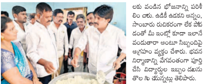
భోజనాన్ని పరిశీలిస్తున్న ఎమ్మెల్యే విజయకుడు

మానవహేతు, ఫిబ్రవరి 5 : విద్యార్థులకు ఇబ్బంది దూరం చేయడానికి అలంపూర్ ఎమ్మెల్యే విజయకుడు భోజనం అందించడం తోపాటు విద్యార్థులకు అభివృద్ధి పనులను ఎమ్మెల్యే విజయకుడు అన్నారు. బుధవారం మండల కేంద్రంలోని కేజీబీవీ రూ. 3 కోట్ల 25 లక్షలతో నిర్మిస్తున్న నూతన భవన నిర్మాణ బుధవారం నిర్మిస్తున్న నూతన భవన నిర్మాణ కార్యక్రమం ప్రారంభం చేశారు. అనంతరం పాఠశాలలో తరగతి గదులు, విద్యార్థులకు