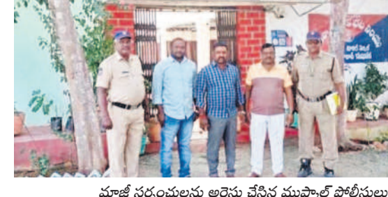
మాజీ సర్పంచులను అరెస్టు చేసిన ముప్పాల్లో పోలీసులు

రుద్రూర్, ఫిబ్రవరి 5 : మండలంలోని రాయకూర్ గ్రామంలో 10 నెలలుగా నీటి సమస్య వేధిస్తున్నది. గ్రామస్థులు అధికారులకు ఎన్నిసార్లు విన్నవించినా తాత్కాలికంగా బ్యాంకర్ల ద్వారా నీటిని సరఫరా చేస్తున్నారే తప్ప సమస్యకు పరిష్కారం చూపడం లేదు. దీంతో ఆగ్రహించిన గ్రామస్థులు జీపీ కార్యదర్శిని గత నెల 28న నిర్బంధించిన విషయం తెలిసింది. అయినా ప్రభుత్వం, అధికారులు స్పందించలేదు.