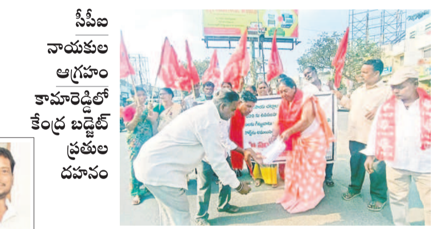
కేంద్ర బడ్జెట్ ప్రతులను దహనం చేస్తున్న సీపీఐ నాయకులు