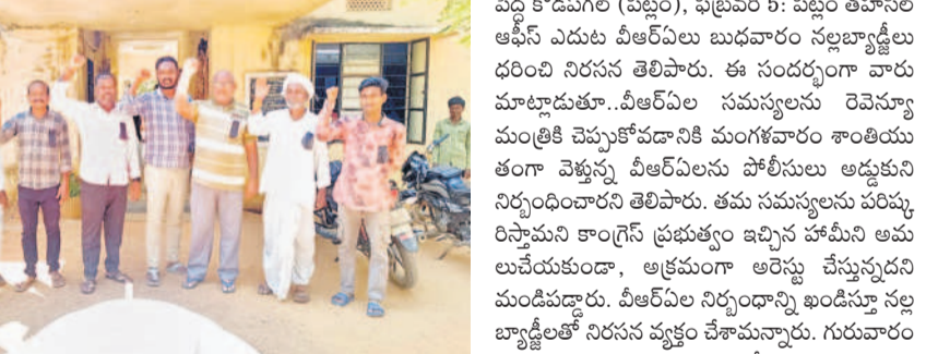
పిట్టలలో నల్ల బ్యాడ్జిల్ ధరించి నిరసన తెలుపుతున్న వీఆర్ ఓలు

పెద్ద కొడవగల్ (పిట్టల), ఫిబ్రవరి 5: పిట్టల తహసీల్ ఆఫీస్ ఎదుట వీఆర్ ఓలు బుద్ధవారం నల్లబ్యాడ్జిల్ ధరించి నిరసన తెలిపారు. ఈ సందర్భంగా వారు మాట్లాడుతూ.. వీఆర్ ఓల సమస్యలను రెవెన్యూ మంత్రికి చెప్పకపోవడానికి మంగళవారం శాంతియుతంగా వెళ్తున్న వీఆర్ ఓలను పోలీసులు అడ్డుకుని నిర్బంధించారని తెలిపారు. తమ సమస్యలను పరిష్కరిస్తామని కాంగ్రెస్ ప్రభుత్వం ఇచ్చిన హామీని అమలు చేయకుండా, అక్రమంగా అరెస్టు చేస్తున్నందున మండిపడ్డారు. వీఆర్ ఓల నిర్బంధాన్ని ఖండిస్తూ నల్ల బ్యాడ్జిల్ తో నిరసన వ్యక్తం చేశామన్నారు. గురువారం సైతం రాష్ట్ర వ్యాప్తంగా నల్ల బ్యాడ్జిల్ ధరించి నిరసన ప్రదర్శనలు చేస్తామని తెలిపారు.