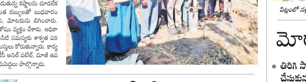
రాయకూర్లో నూతనంగా మోటరు చేయించిన గ్రామస్థులు