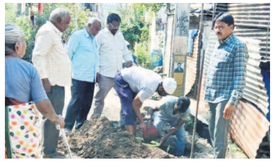
కుశాయి పన్ను చెల్లించని ఇంటి నల్ల కనెక్షన్ తొలగిస్తున్న సిబ్బంది

కంఠేశ్వర్, ఫిట్రవరి 5 : నగర వాసులు కుళాయి పన్ను చెల్లించాలని మున్ని పల్ డిప్యూటీ కమిషనర్ రాజేంద్రకుమార్ కోరారు. నగరంలోని నీటి పన్ను చెల్లించని పలు ఇండ్ల నల్లా కనెక్షన్లను బుధవారం తొలగించారు. నీటి పన్ను చెల్లించకుంటే సరఫరా నిలిపివేస్తామని హెచ్చరించారు.